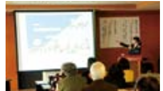
環境市民講座の様子