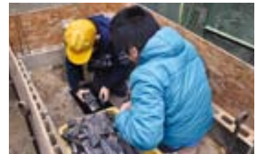
竹炭づくりの様子