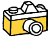
PHOTO DIARY まちの話題