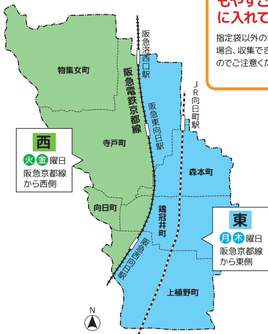
【もやすごみ収集マップ】