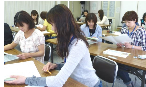
H24.6.開催 子育てサポーター養成講座のようす