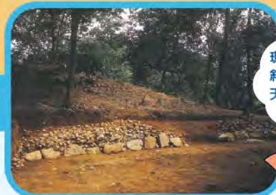
現在、後方部の斜面には石槨の天井石が残っているよ！

墓石や天井石はたくさんの人々が運んでいたんだろうね！向日市文化資料館に行ってみてね！天井石が展示されているよ。