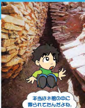
本当は木棺の中に葬られてたんだよね。

後方部の中央は首長を葬ったところです。一番下に粘土をしき、その上に板石をていねいに積み上げ、長方形の部屋(石槨)がつけられました。全長5.6m、北端幅1.3m、南端幅1.0m、高さ1.9mと長く大きい部屋でした。天井石は11枚あります。遺体を葬り、とむらいのマツリが終わると土で埋めもどされました(右図)。遺体は、竹を割ったような形(割竹形)の木棺におさめられていました。刀剣、櫛、鏡、斧、鏝、刀子、鋤、鍬先などの副葬品も残されていました。