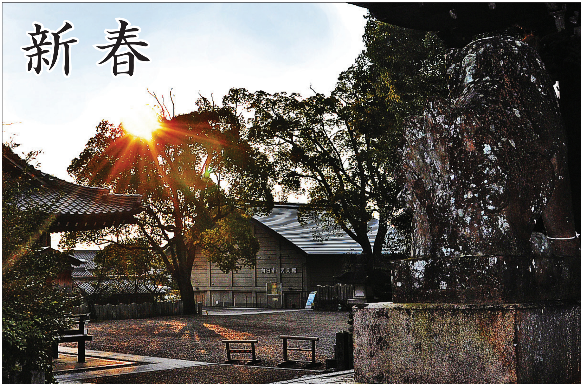
▲希望を映す朝の光(向日神社から)