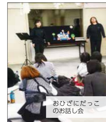
おひぎにだっこのお話会

お話し会では、西ノ岡ラ・コンフィティによるパネルシアターや絵本の読み聞かせなどを主任児童委員と一緒に進めています。 令和5年度は年4回、保健センターで健康相談の日に実施しました。会場では、お子さんを抱っこしながら一緒に体をゆすり、絵本の世界を楽しんでいる微笑ましい親子の姿が見られました。