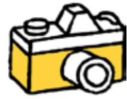
PHOTO DIARY まちの話題