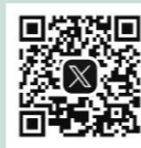
向日市観光協会 X (twitter)