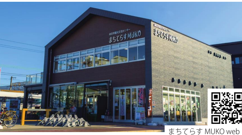
まちてらす MUKO web

向日市の観光案内の窓口として、観光ガイドの受付や市内のおすすめスポットを紹介している。