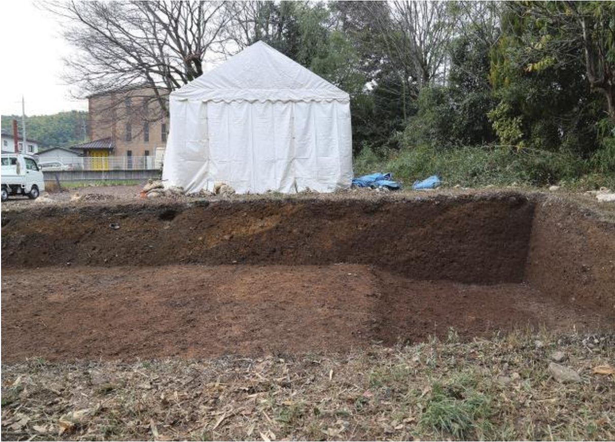
(1) 第 11 次調査 北土壘断面 - 1 (東から)