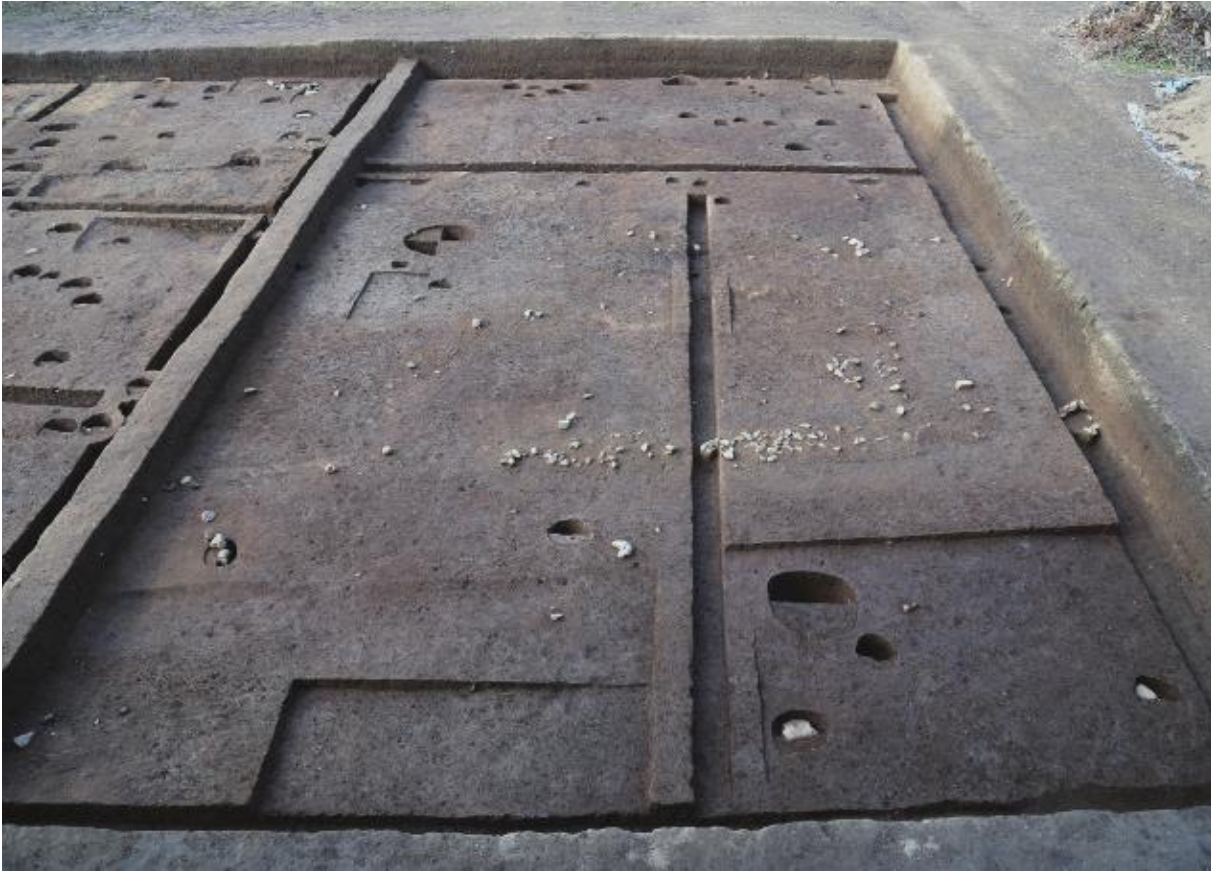
(1) 第 10 次調査北半 (東から)