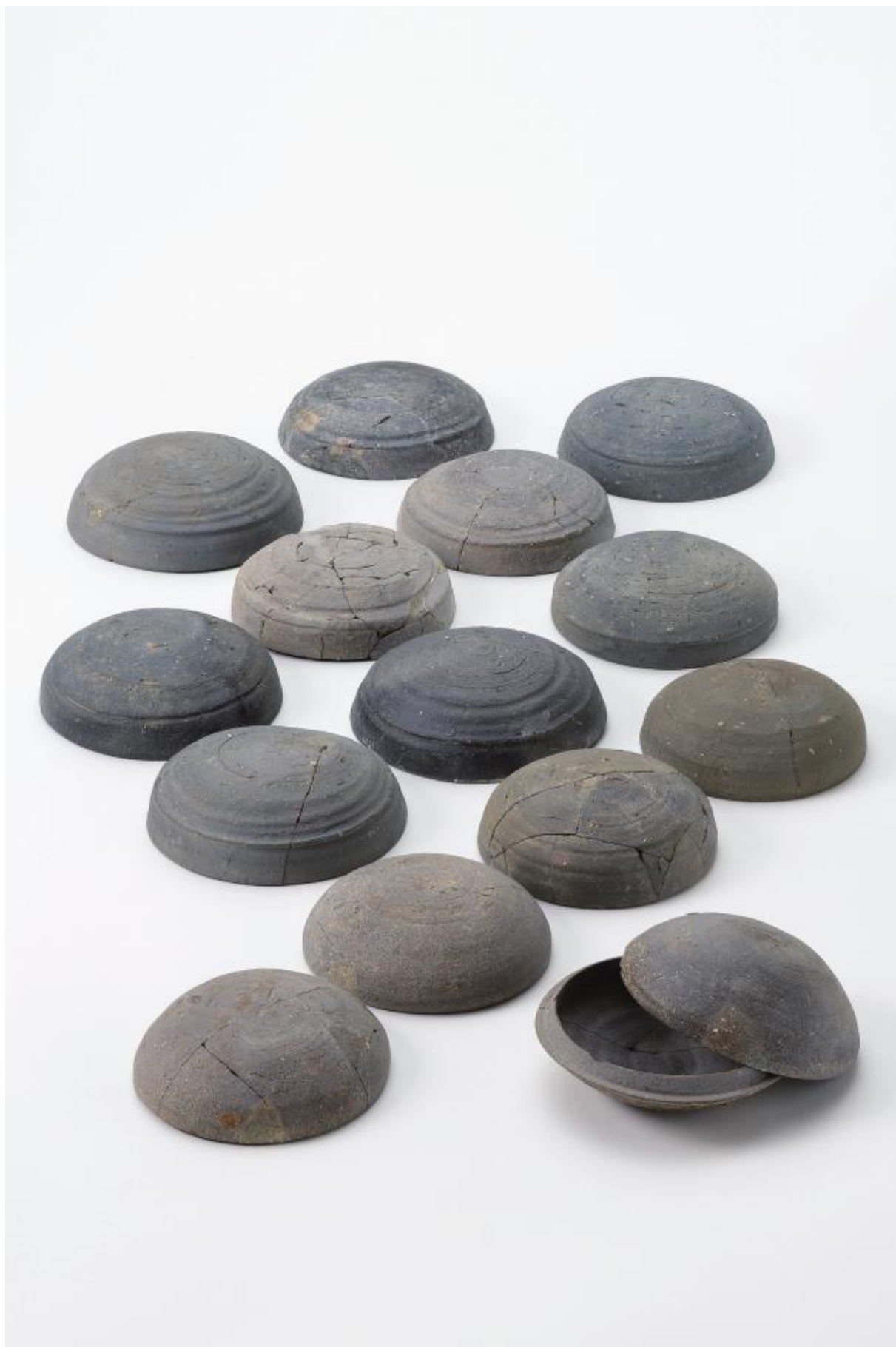
物集女城跡周辺出土遺物 - 8 (物集女車塚古墳第3次)