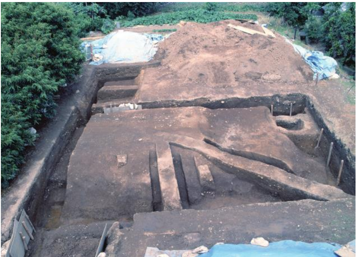
(2) 第5次調査 土塁南西隅部-1（西から）