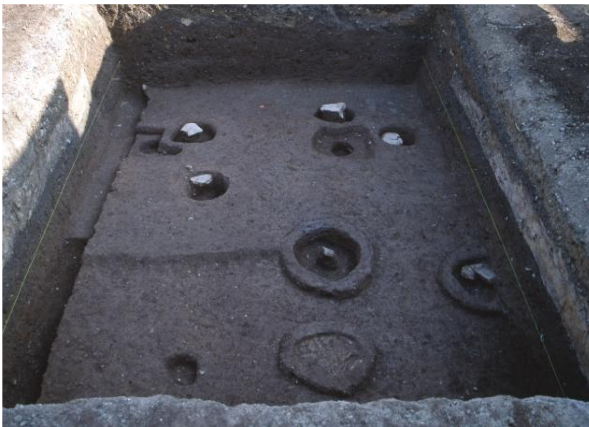
(2) 中海道遺跡第40次調査全景（西から）