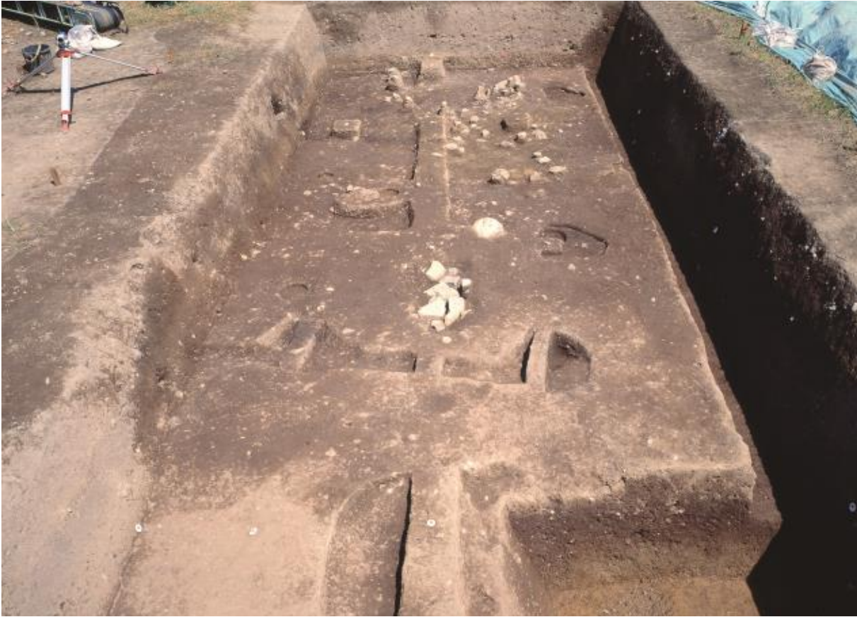
(1) 第8次調査第2トレンチ全景（西から）