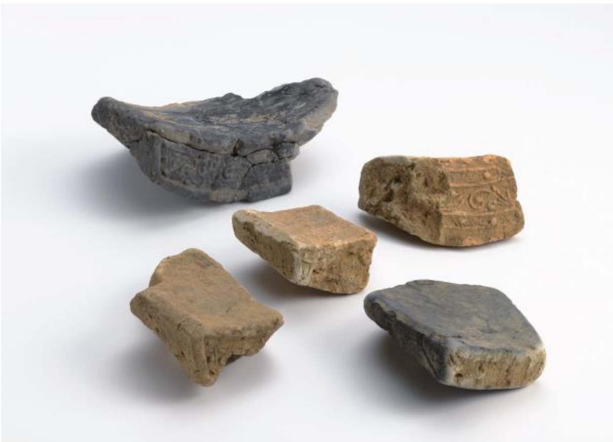
(2) 物集女城跡周辺出土遺物 - 12 (物集女車塚古墳第2次・物集女車塚周辺遺跡第8次)