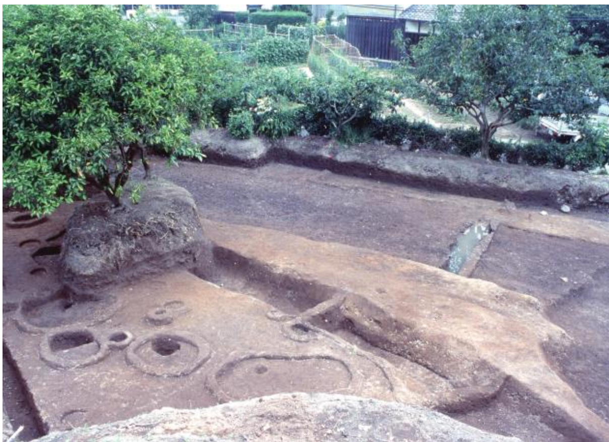
(2) 中海道遺跡第21次調査全景（南西から）