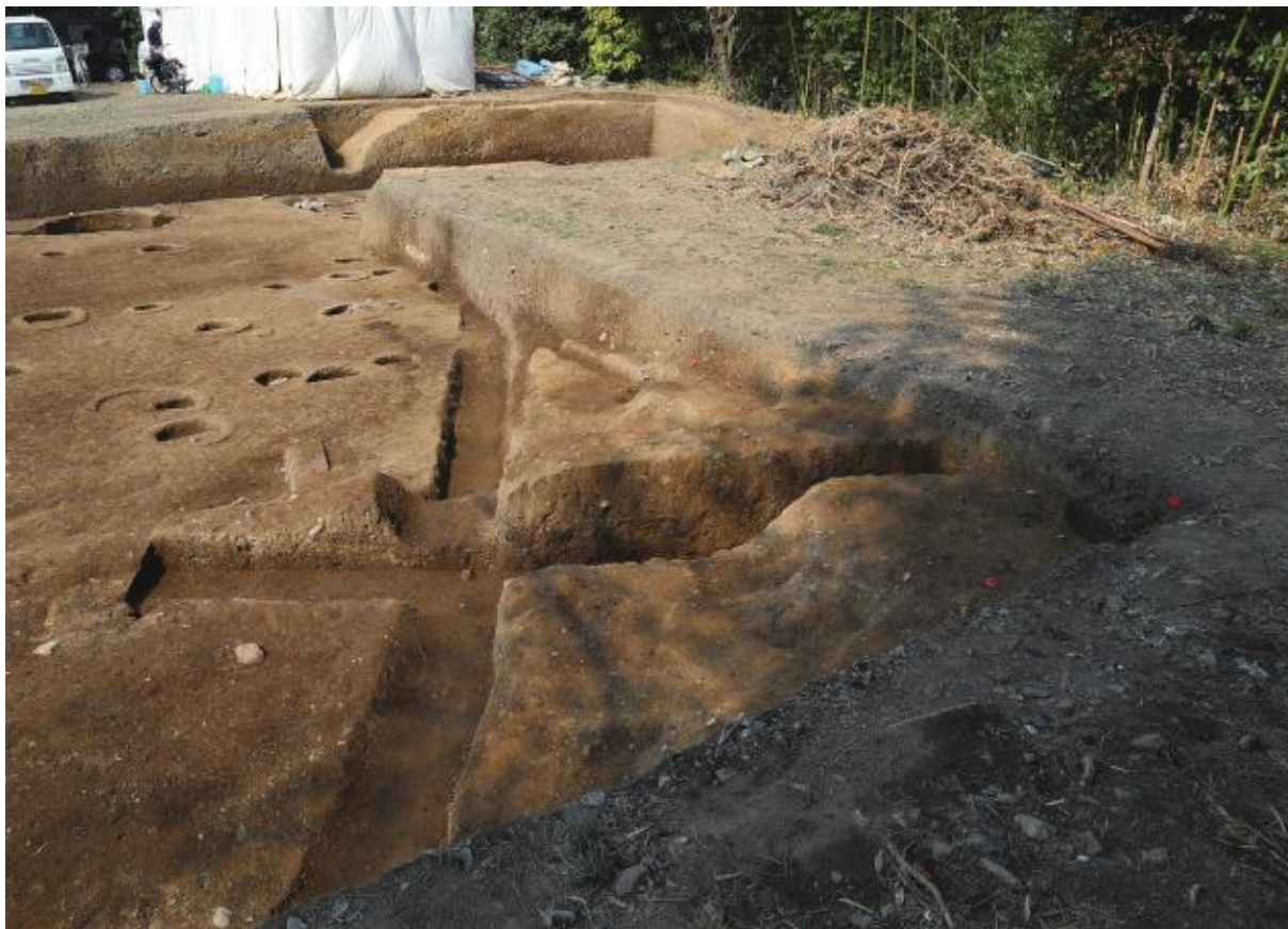
(1) 第 11 次調査 北東土塁 - 1 (南東から)