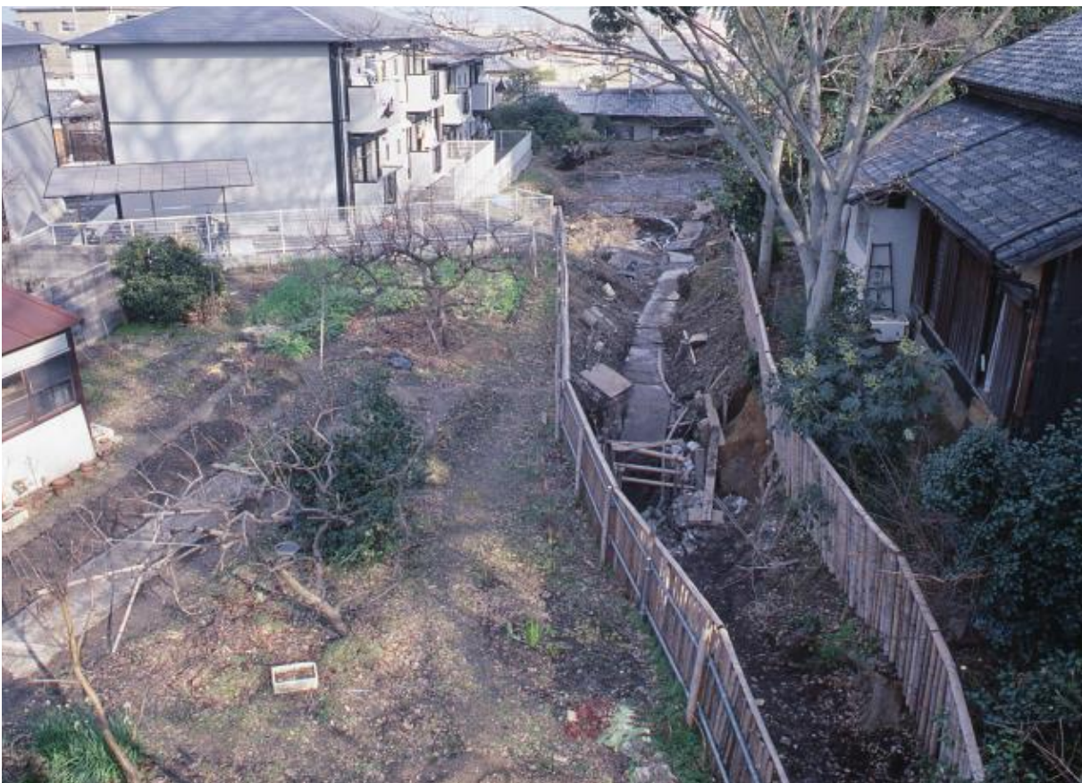
(2) 第3次調査 北堀 (西から)