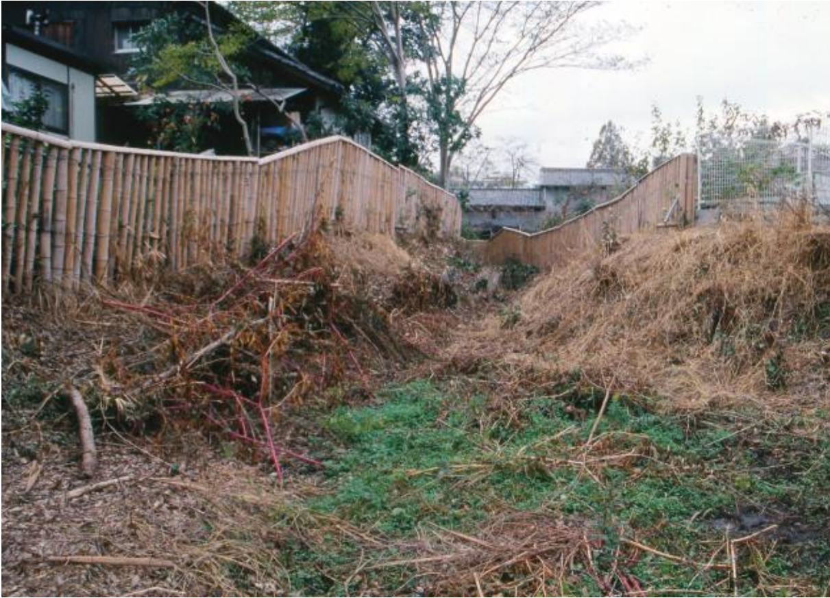
(1) 第2次調査 北堀 (東から)