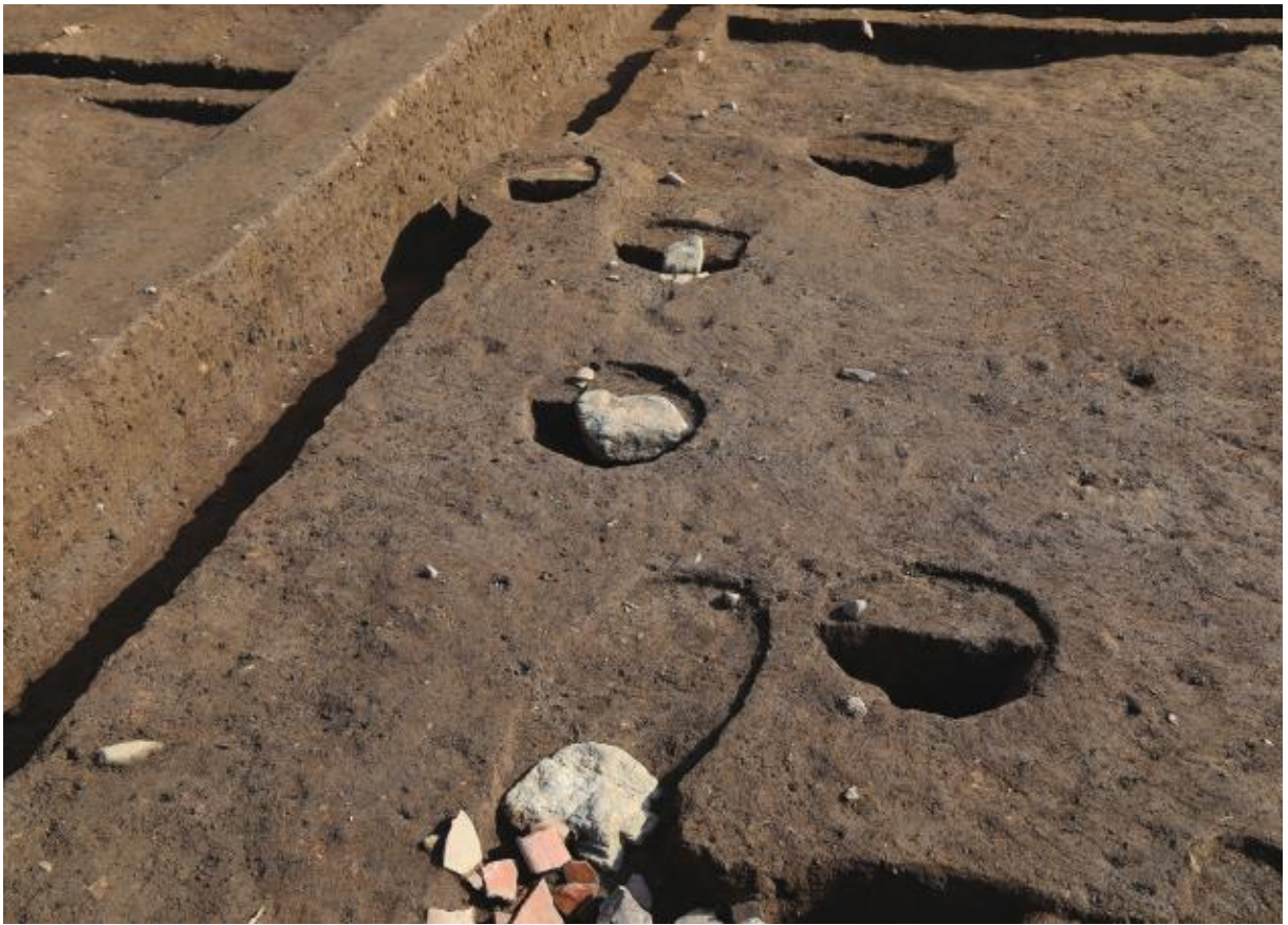
(1) 第10次調査 礎石をもつピット (西から)