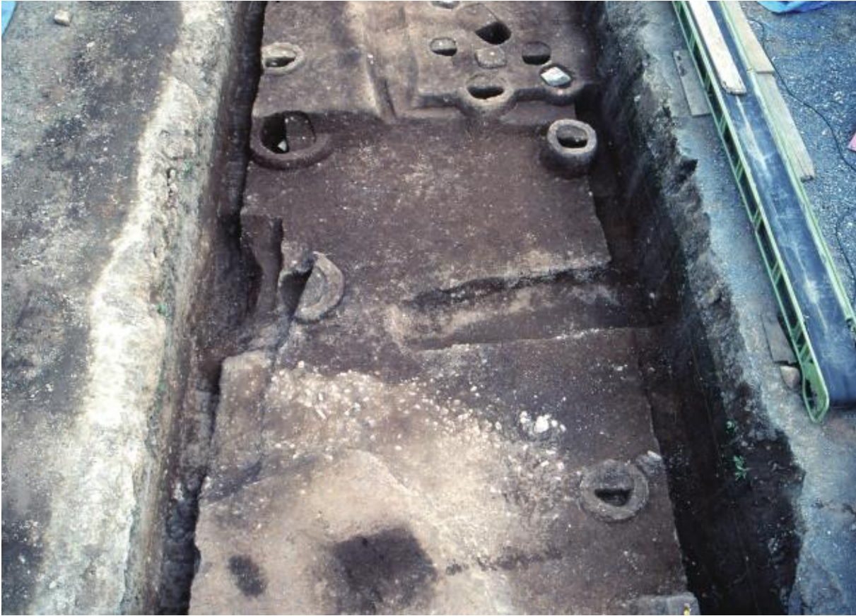
(1) 中海道遺跡第38次調査 溝S D 3807 (北から)