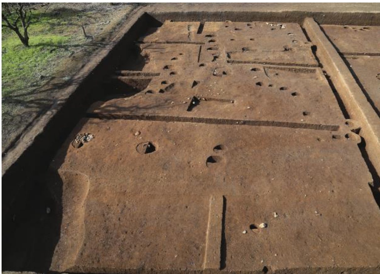
(1) 第 10 次調査南半 (東から)