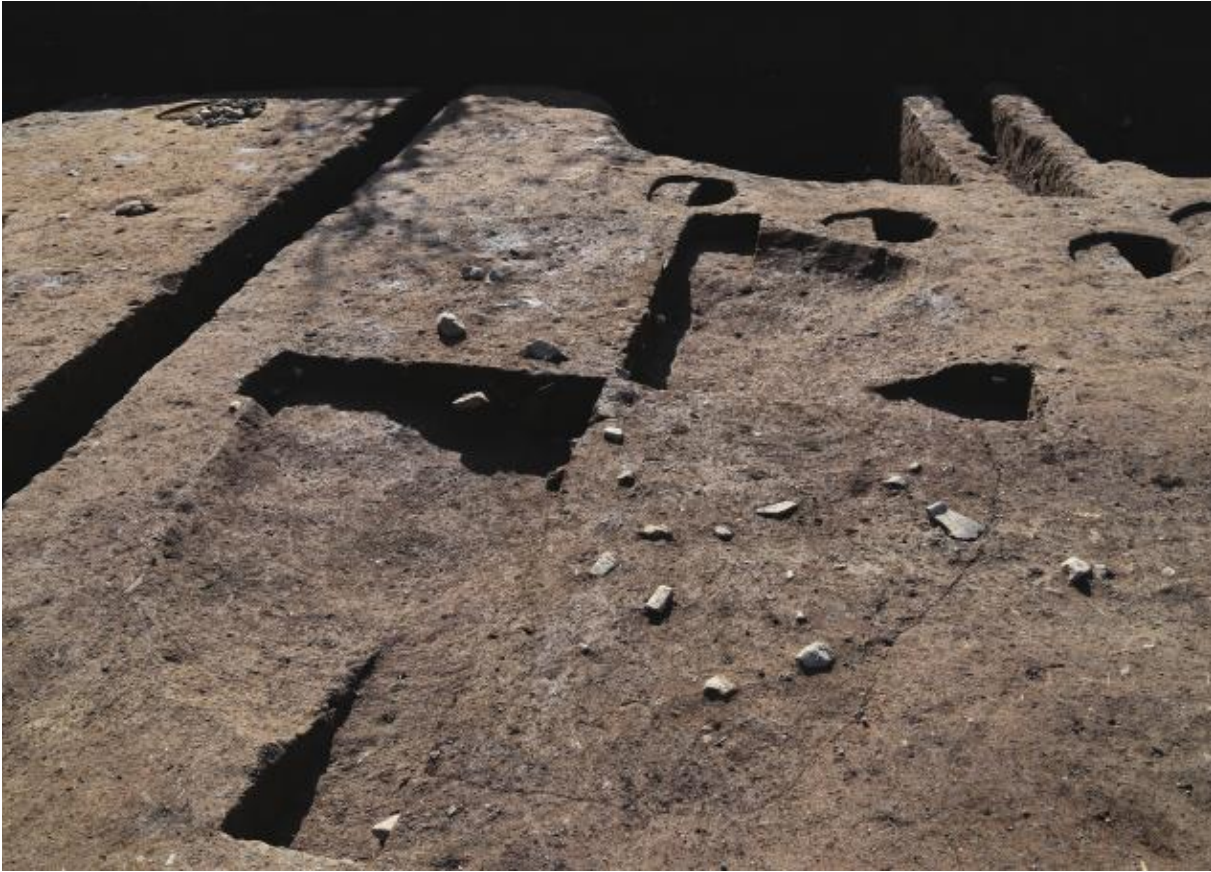
(1) 第10次調査 土坑S K 1010 (北から)