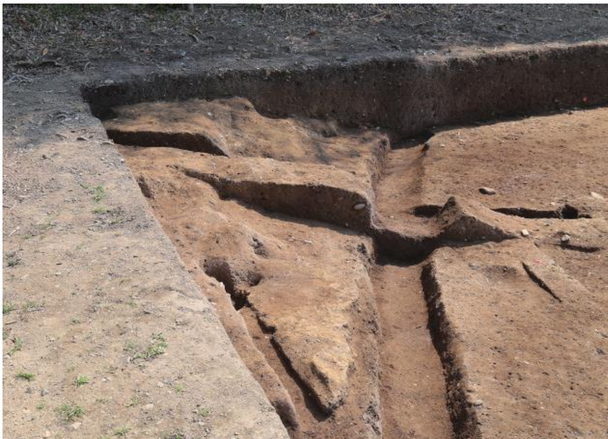
(2) 第 11 次調査 北東土塁 - 2 (北西から)