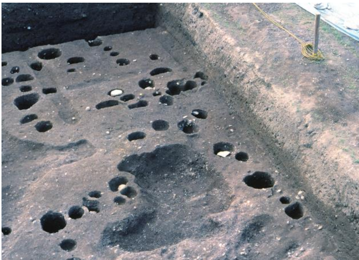
(2) 第7次調査 柵S A 0710 (北から)