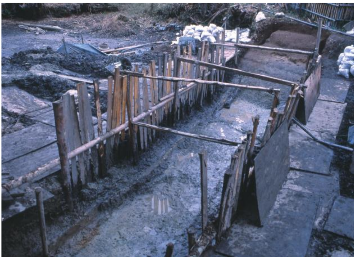
(2) 第3次調査 東堀北東部3-2トレンチ (南から)