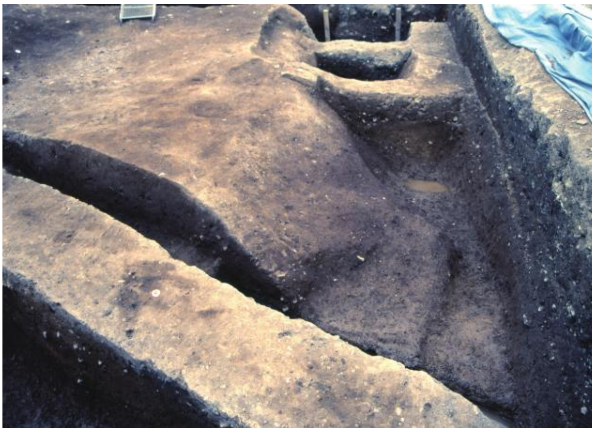
(1) 第5次調査 南土塁・南堀（西から）