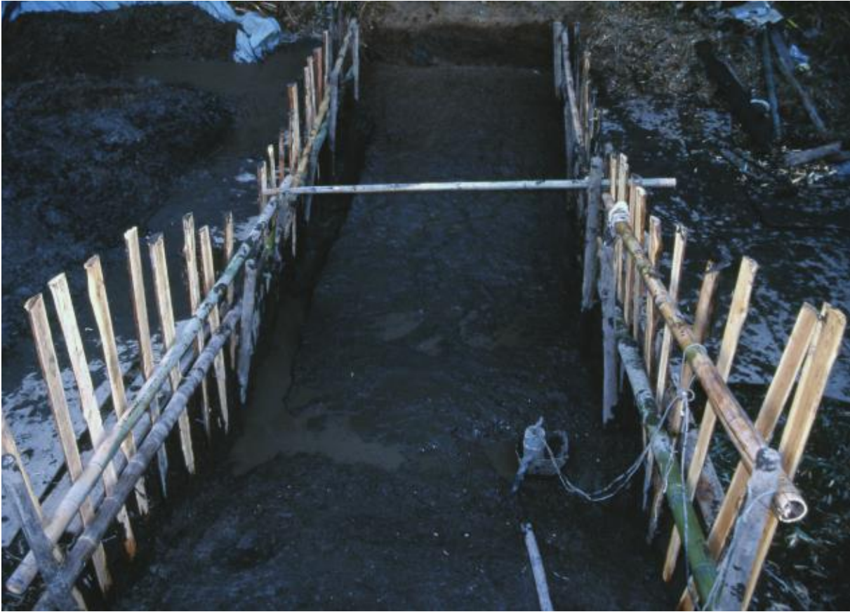
(1) 第2次調査 東堀中央部2-3トレンチ (東から)