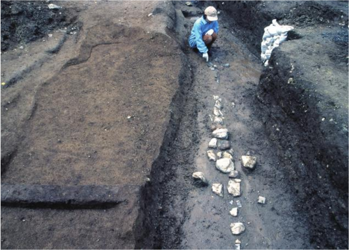
(1) 中海道遺跡第37次調査 溝S D 0704・石組S X 0721 (東から)