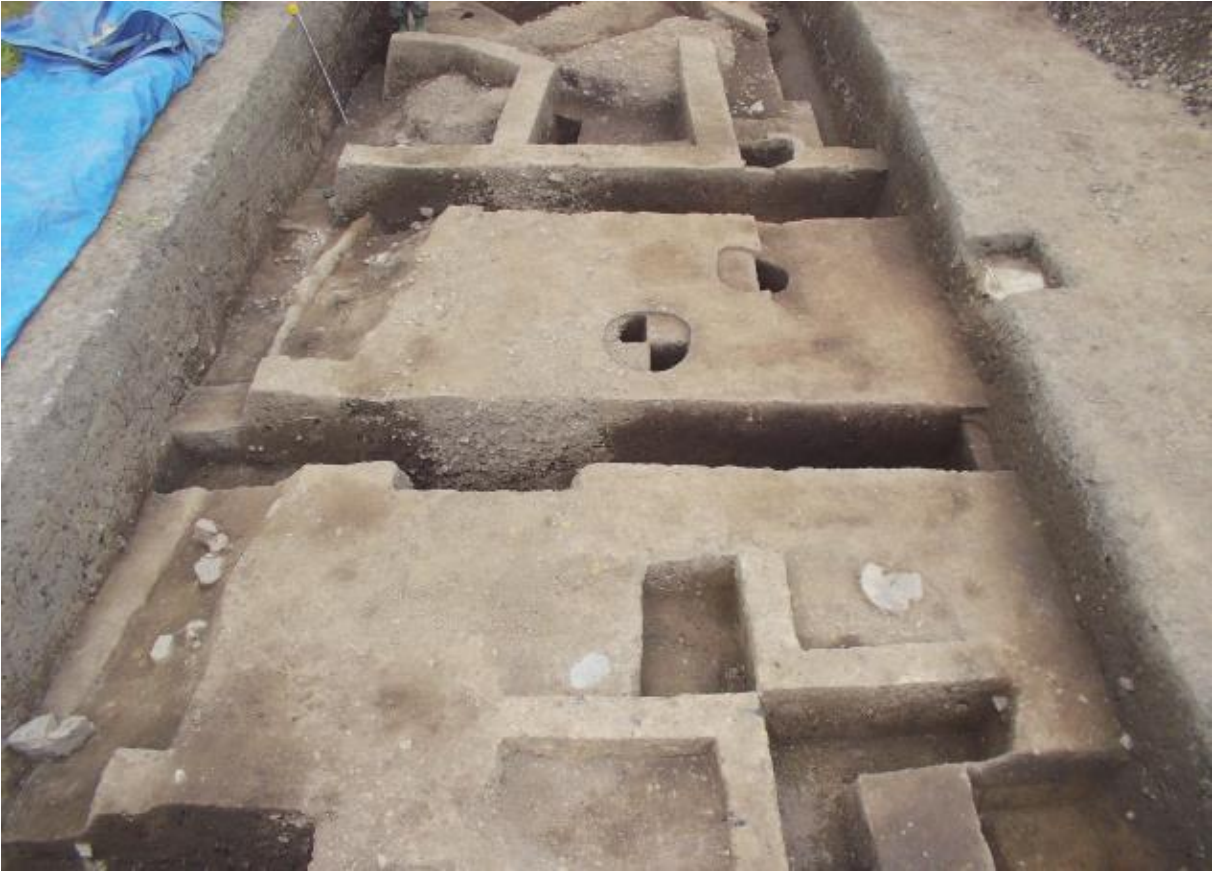
(1) 中海道遺跡第73次調査全景（南東から）