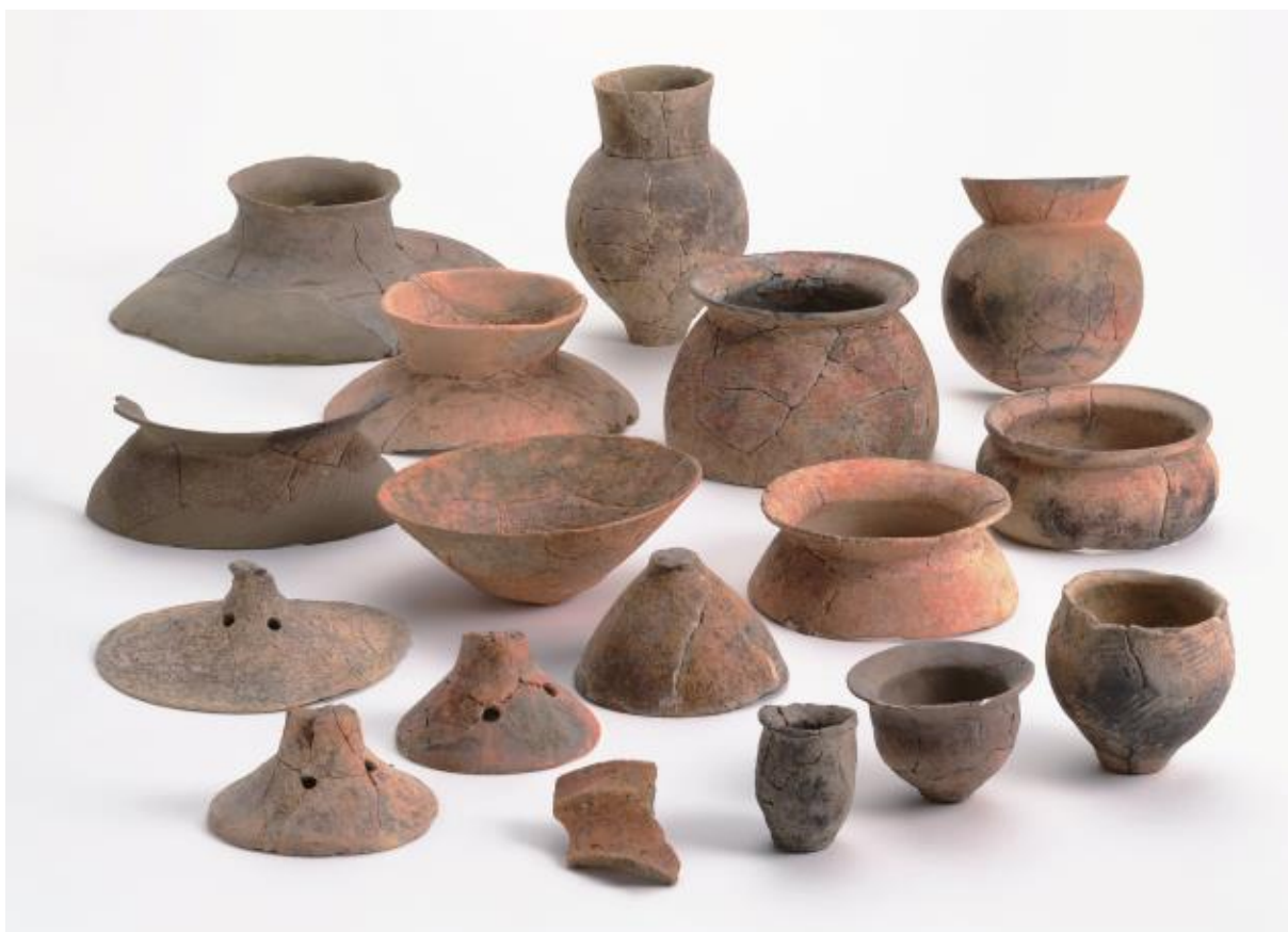
(2) 物集女城跡周辺出土遺物 - 2 (中海道遺跡第32次)