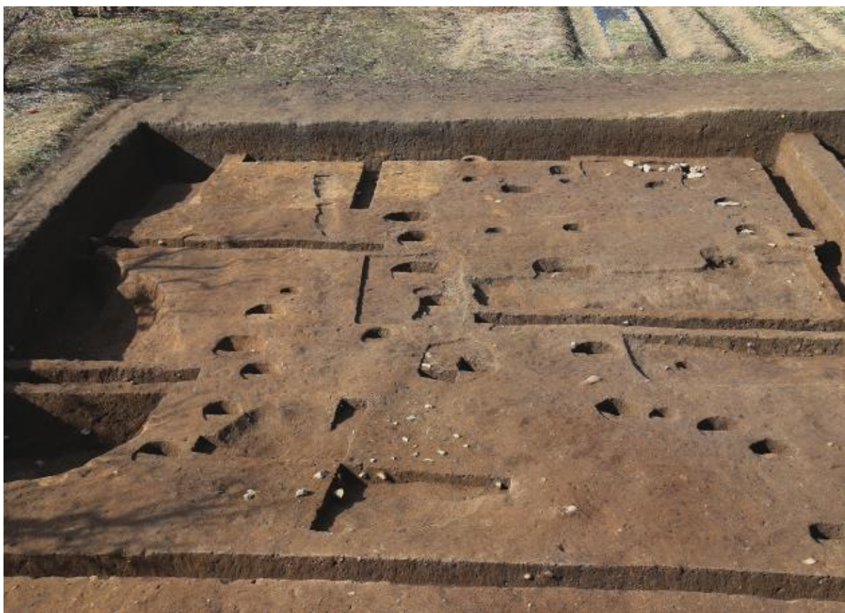
(2) 第 10 次調査南西部 (東から)