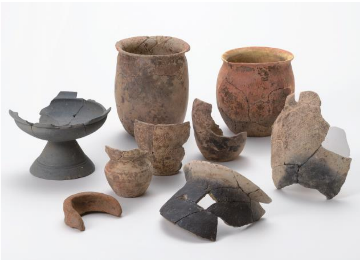
(2) 物集女城跡周辺出土遺物 - 4 (中海道遺跡第 3・21・73 次)