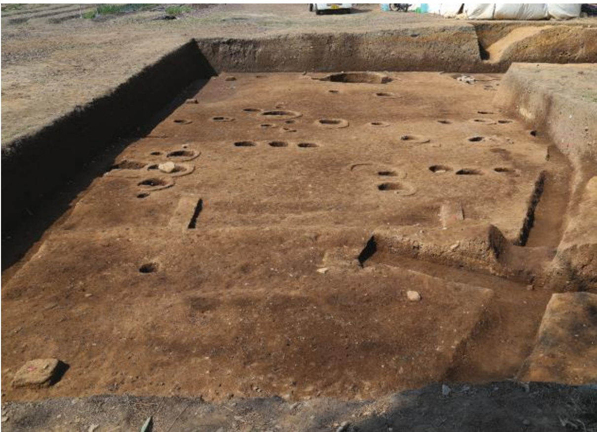
(2) 第11次調査西半（東から）