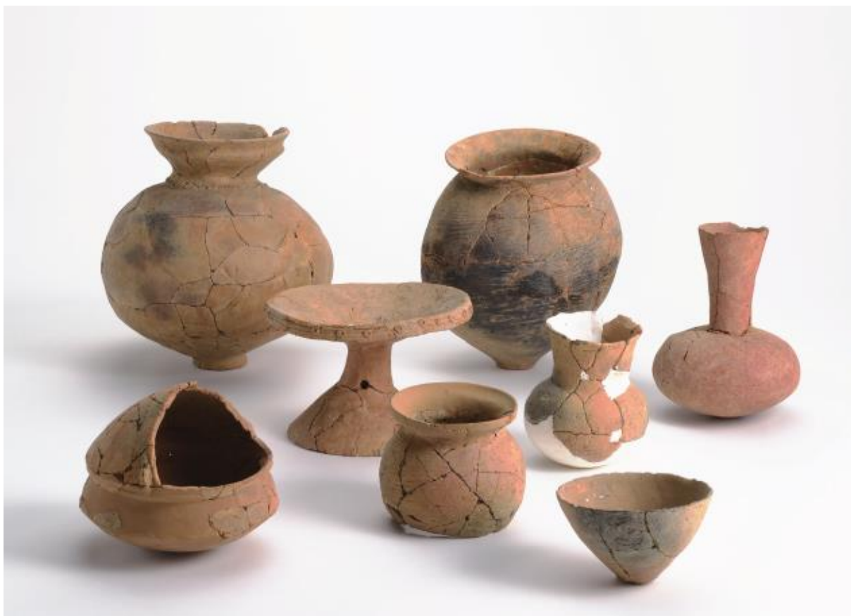
(1) 物集女城跡周辺出土遺物 - 1 (中海道遺跡第1次)