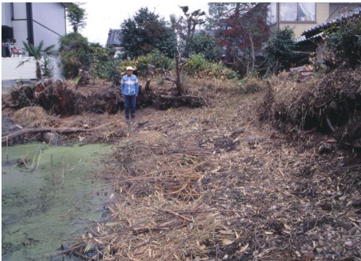
(1) 第2次調査 東堀東堤部 (南から)