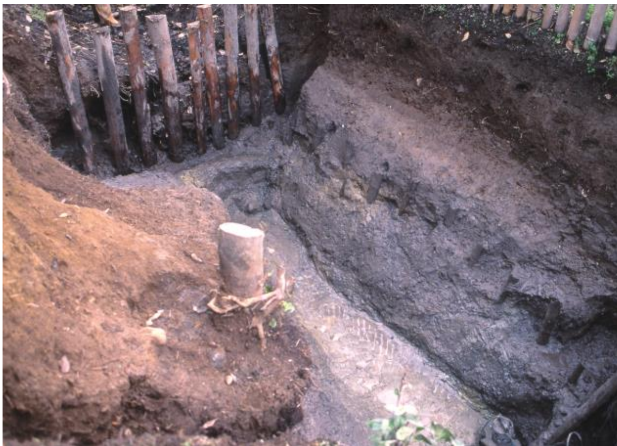
(1) 第3次調査 北堀3-1トレンチ (南東から)