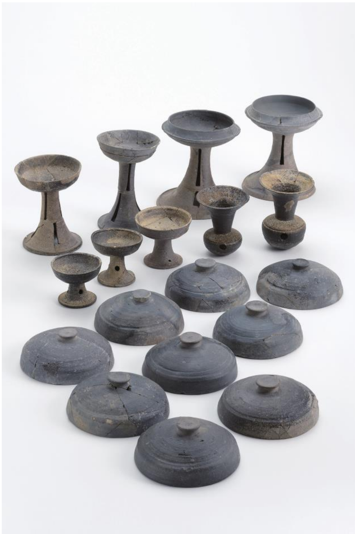
物集女城跡周辺出土遺物 - 9 (物集女車塚古墳第 3 次)