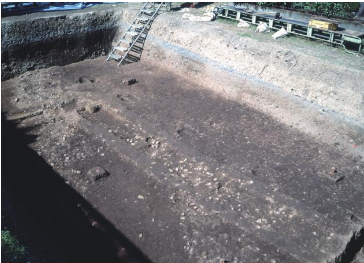
(1) 第9次調査第1トレンチ全景 (南から)