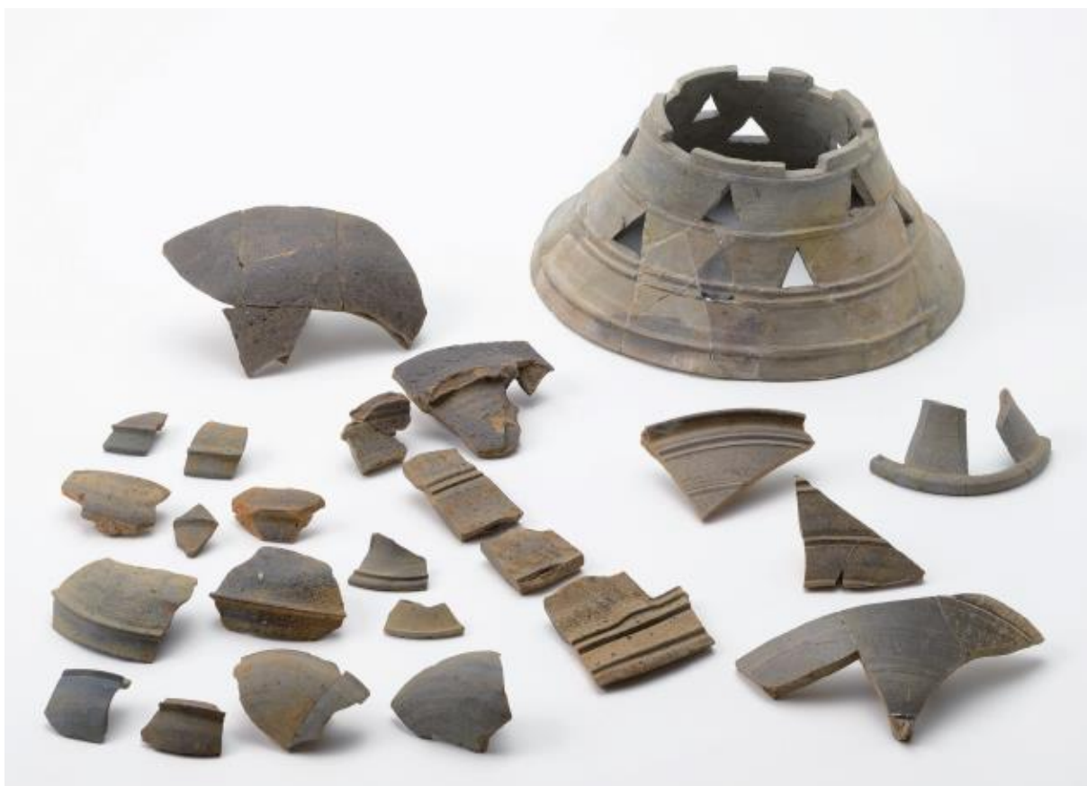
(2) 物集女城跡周辺出土遺物 - 6 (南条古墳第3次)