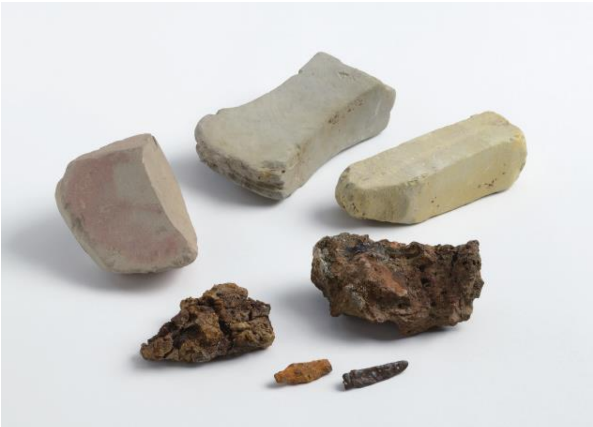
(1) 物集女城跡周辺出土遺物 - 3 (中海道遺跡第 19・32 次)