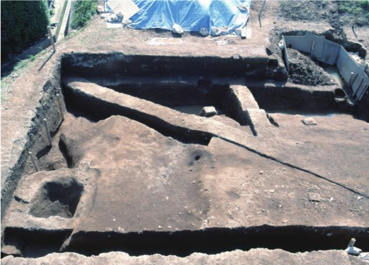
(1) 第5次調査 土塁南西隅部-2 (東から)