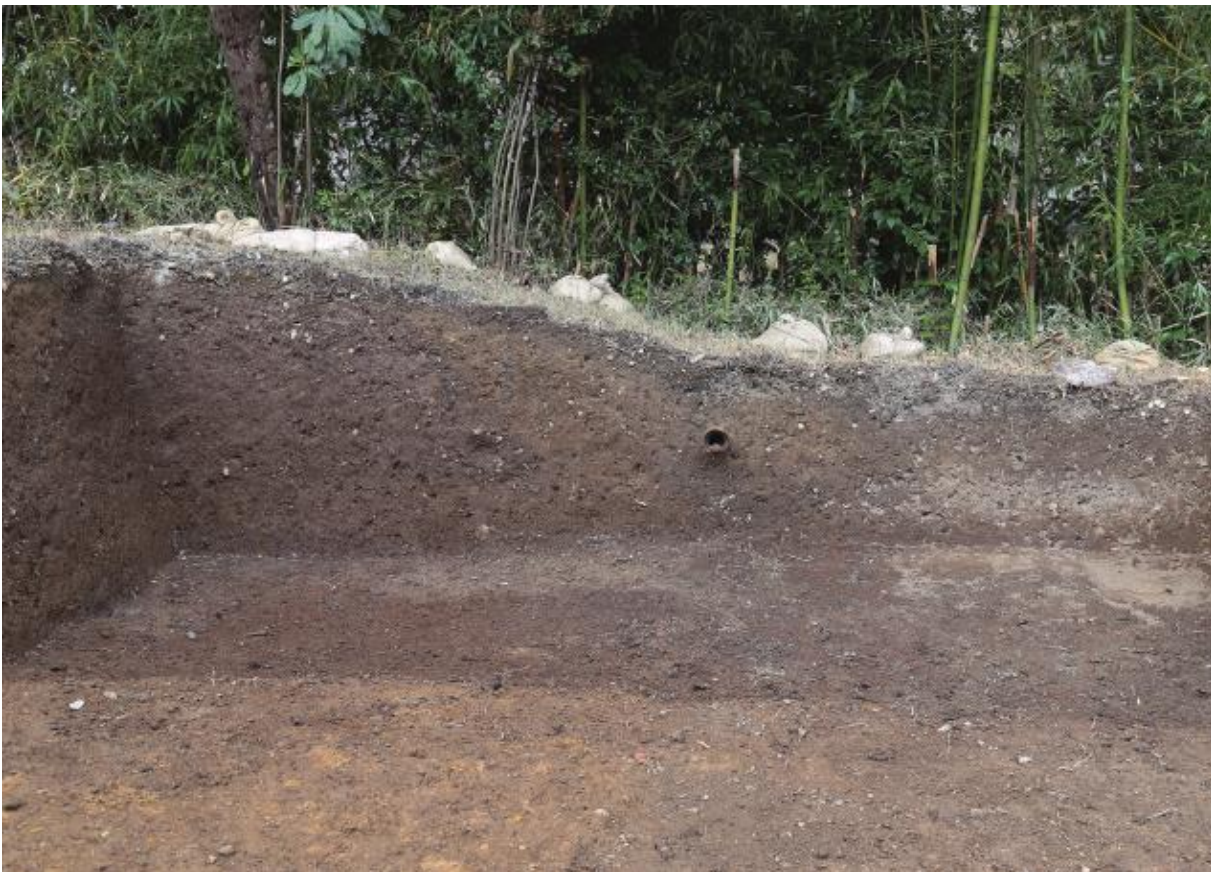
(2) 第 11 次調査 北土壘断面 - 2 (南から)