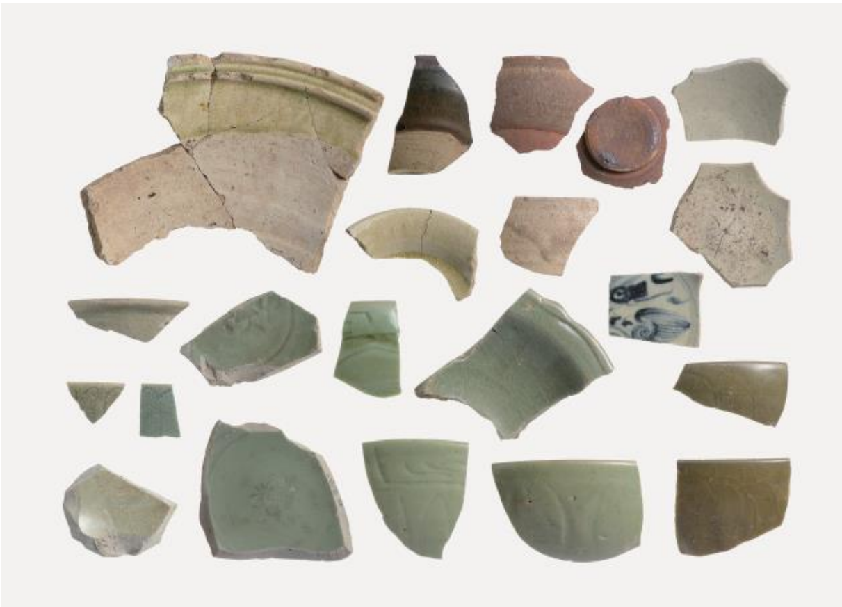
(1) 物集女城跡出土遺物 - 1