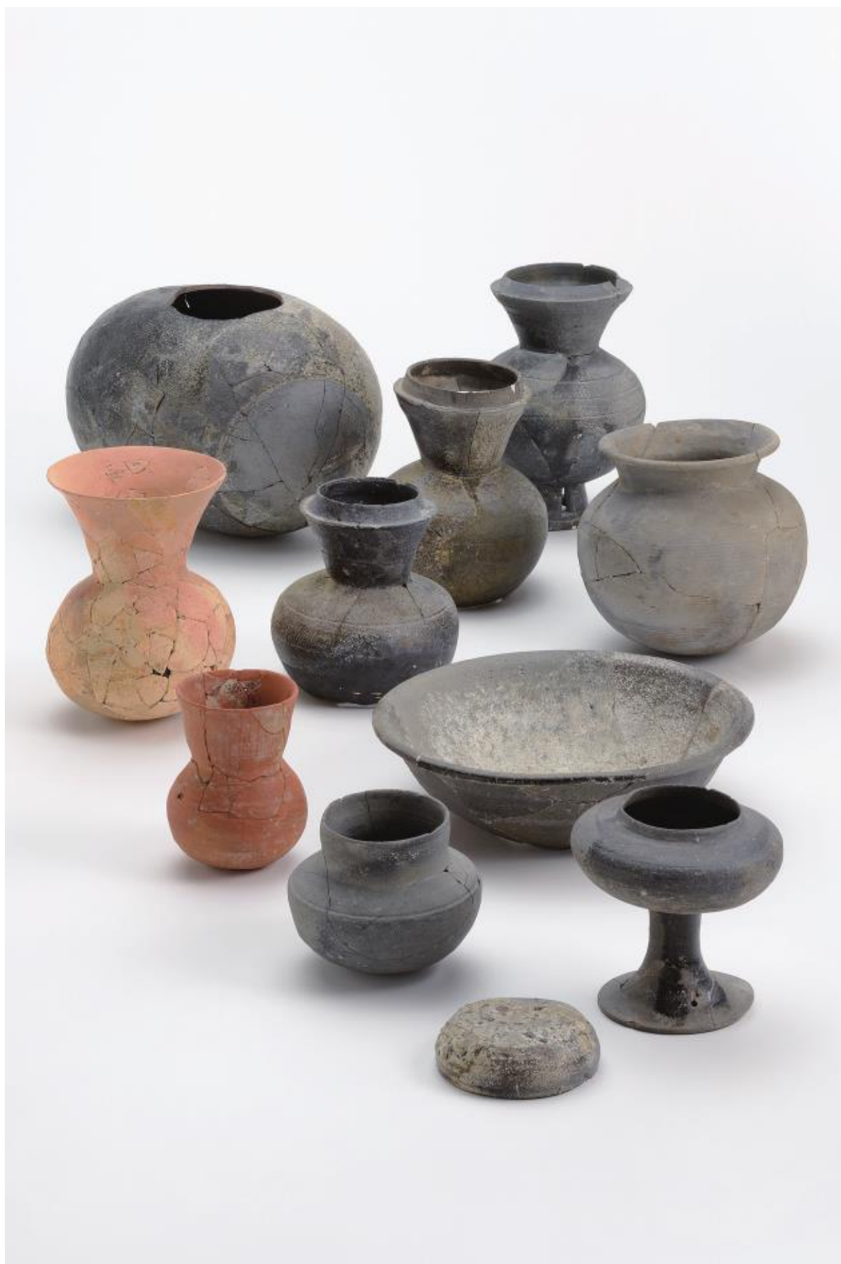
物集女城跡周辺出土遺物 - 10 (物集女車塚古墳第3次)