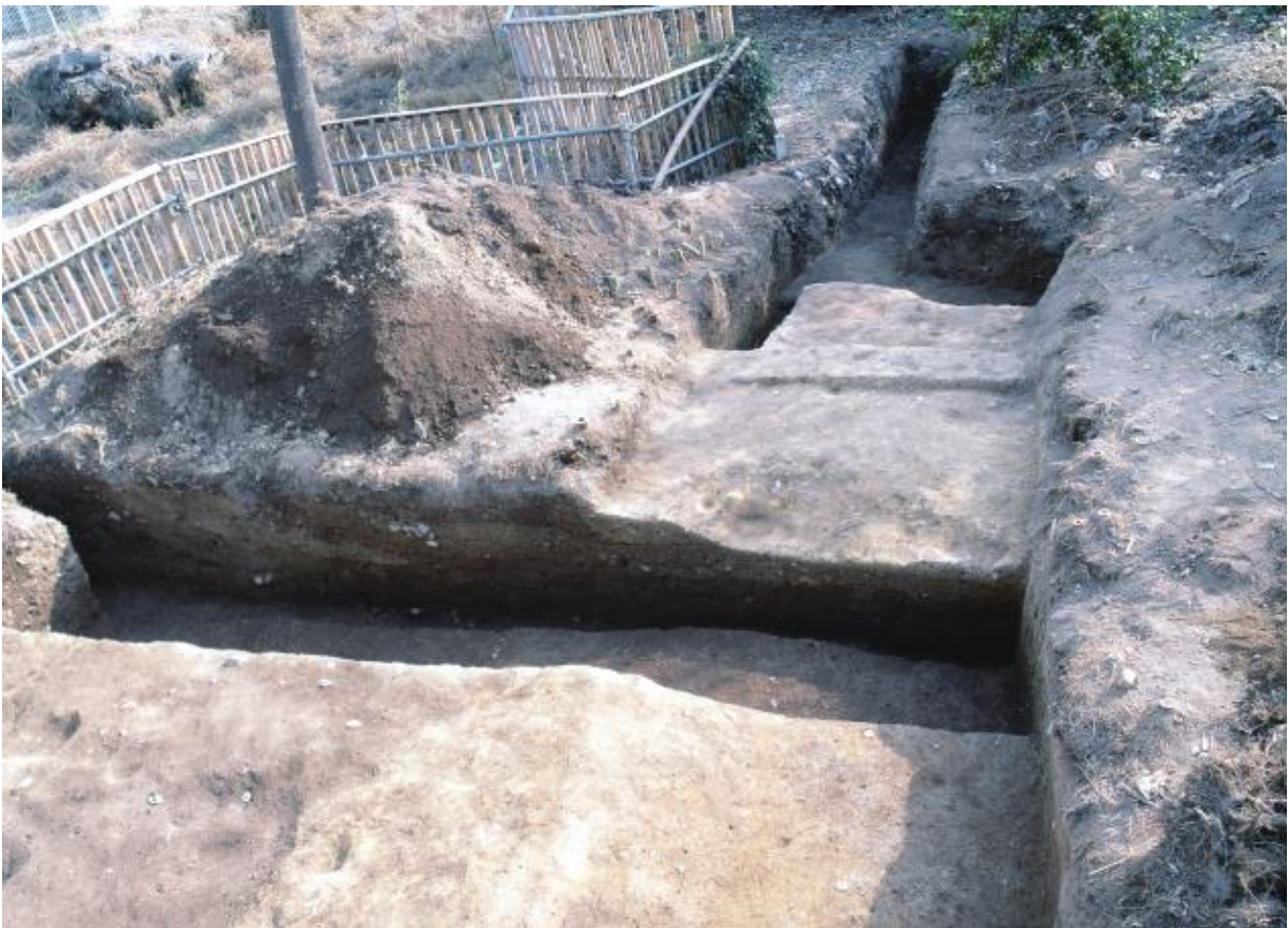
(2) 第4次調査 土壘南東隅部 (北から)