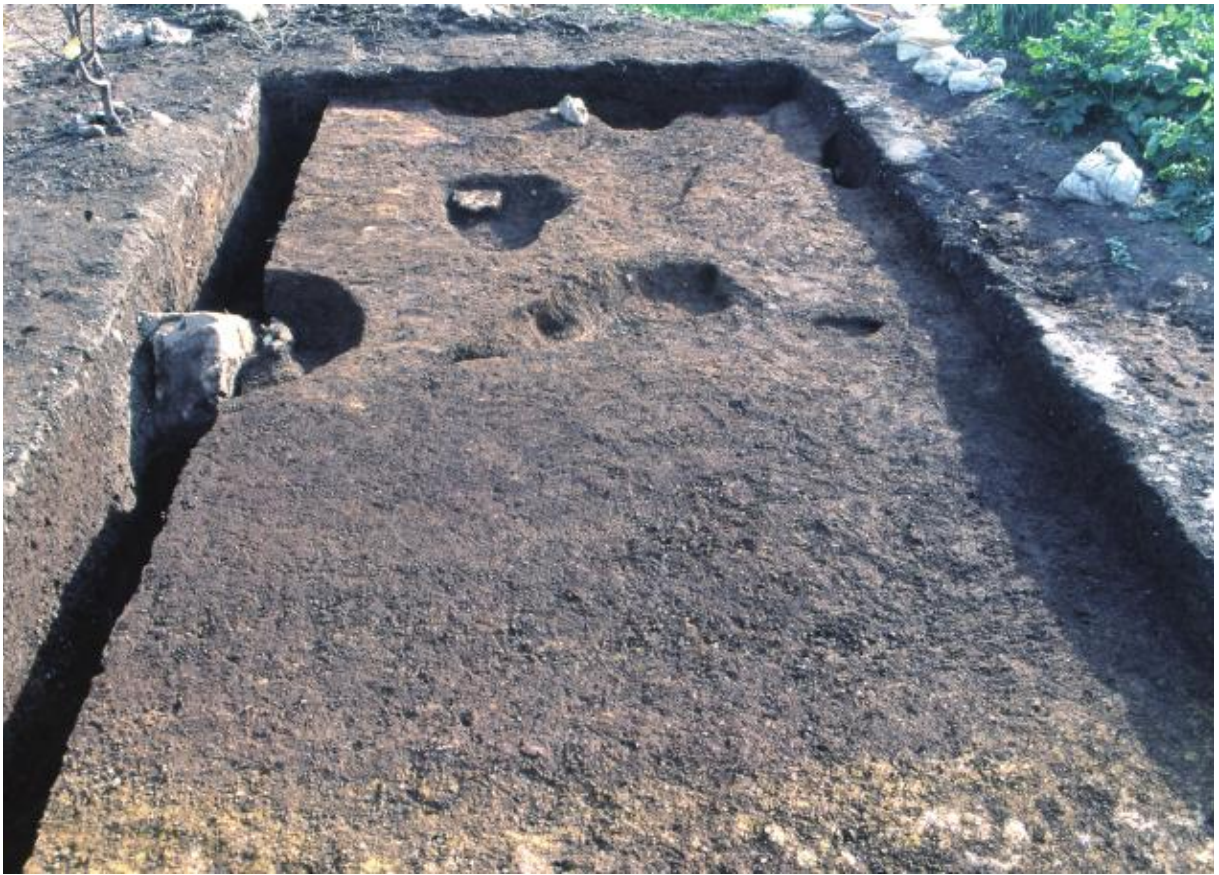
(1) 第6次調査 南土塁（北から）