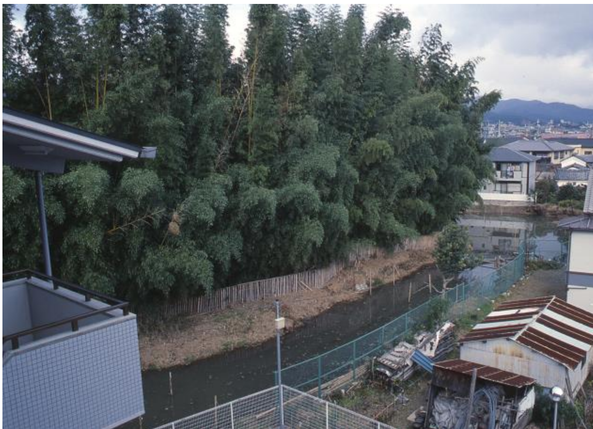
(1) 第3次調査 東土壘・東堀 (南東から)