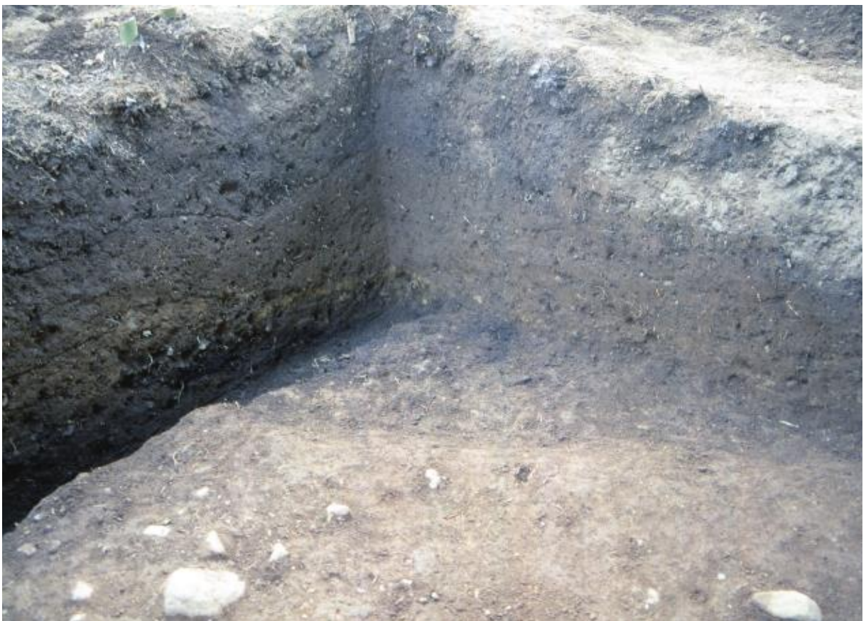
(2) 第4次調査 土坑S K 0405 (北東から)