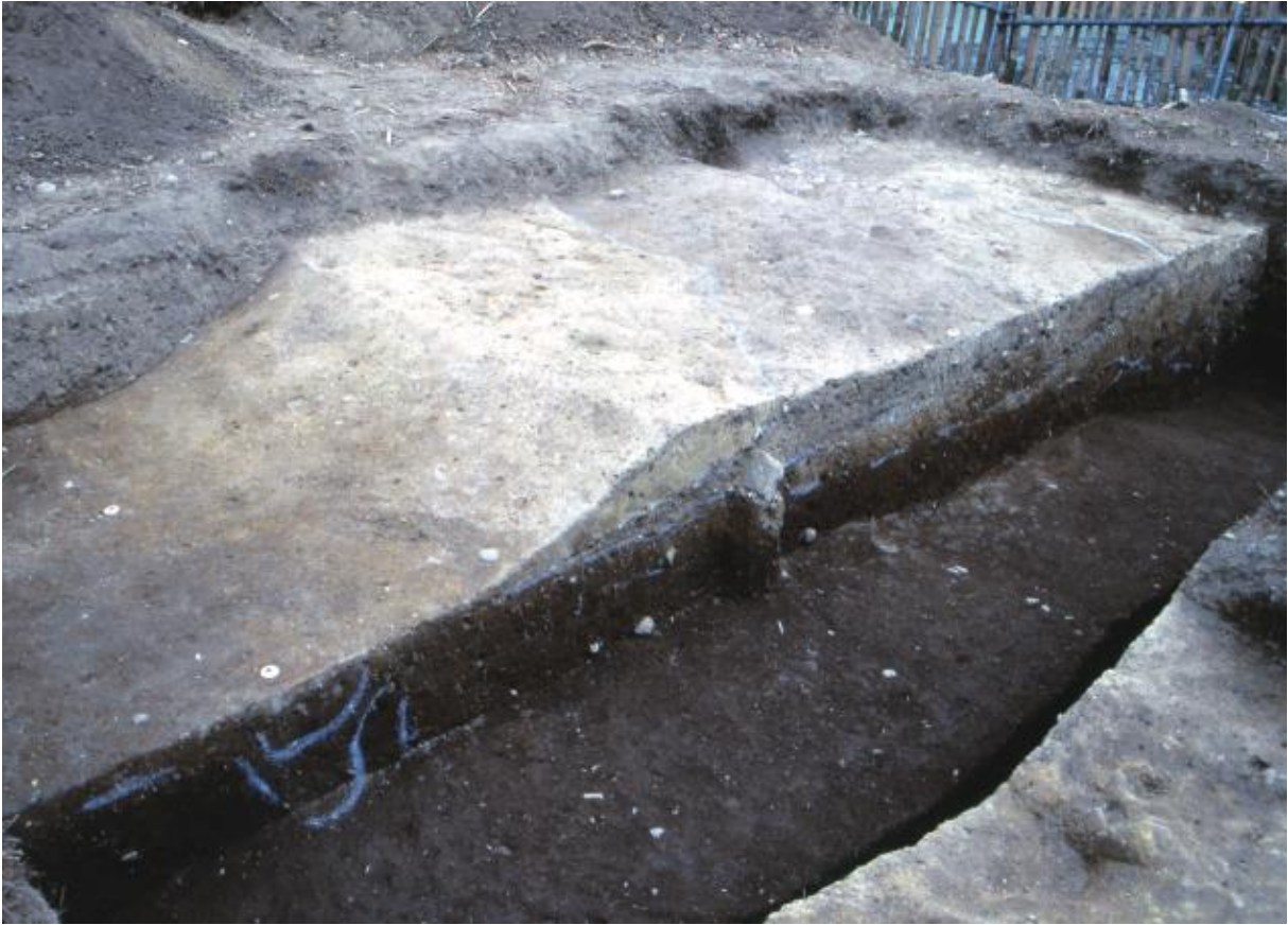
(1) 第4次調査 東土壘基底部 (南西から)