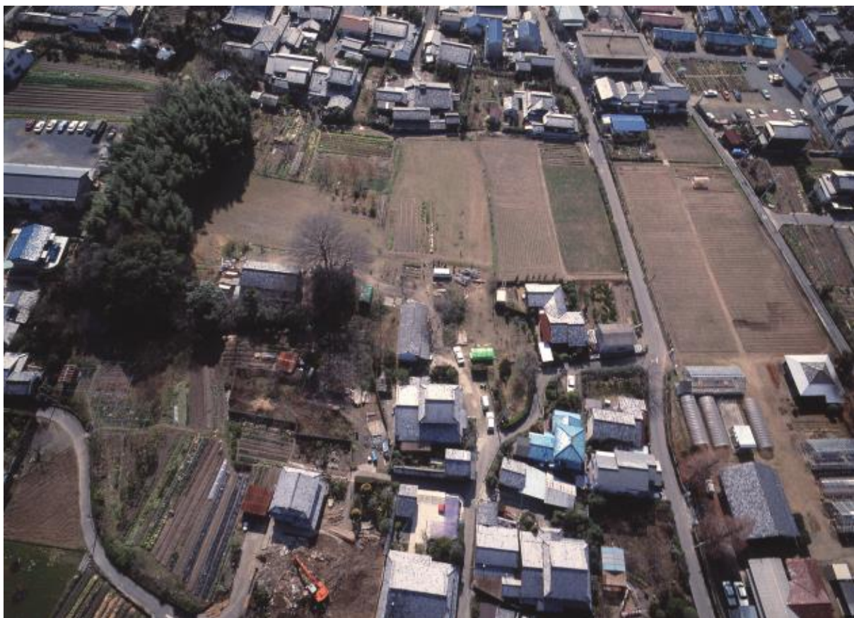
(1) 全景空撮写真-1 (南から、平成2年撮影)