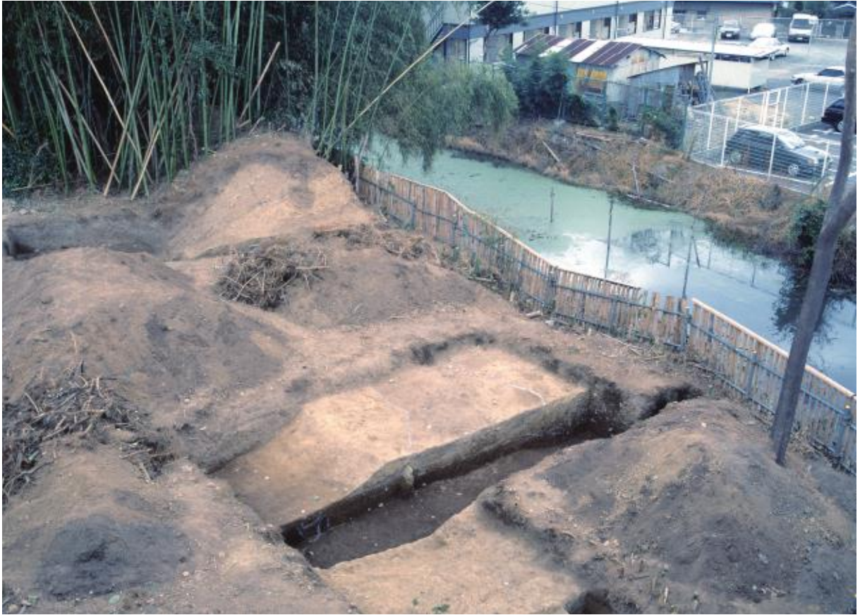
(1) 第4次調査 東土塁-1 (南から)