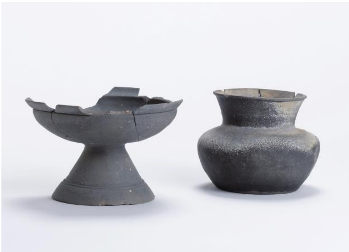
(1) 物集女城跡周辺出土遺物 - 5 (中海道遺跡第73次・芝ヶ本遺跡第1次)