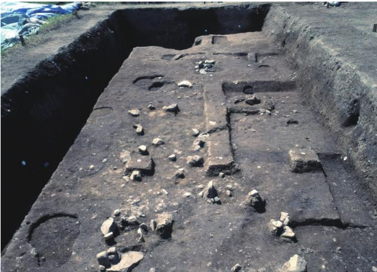
(2) 第8次調査第2トレンチ全景（東から）