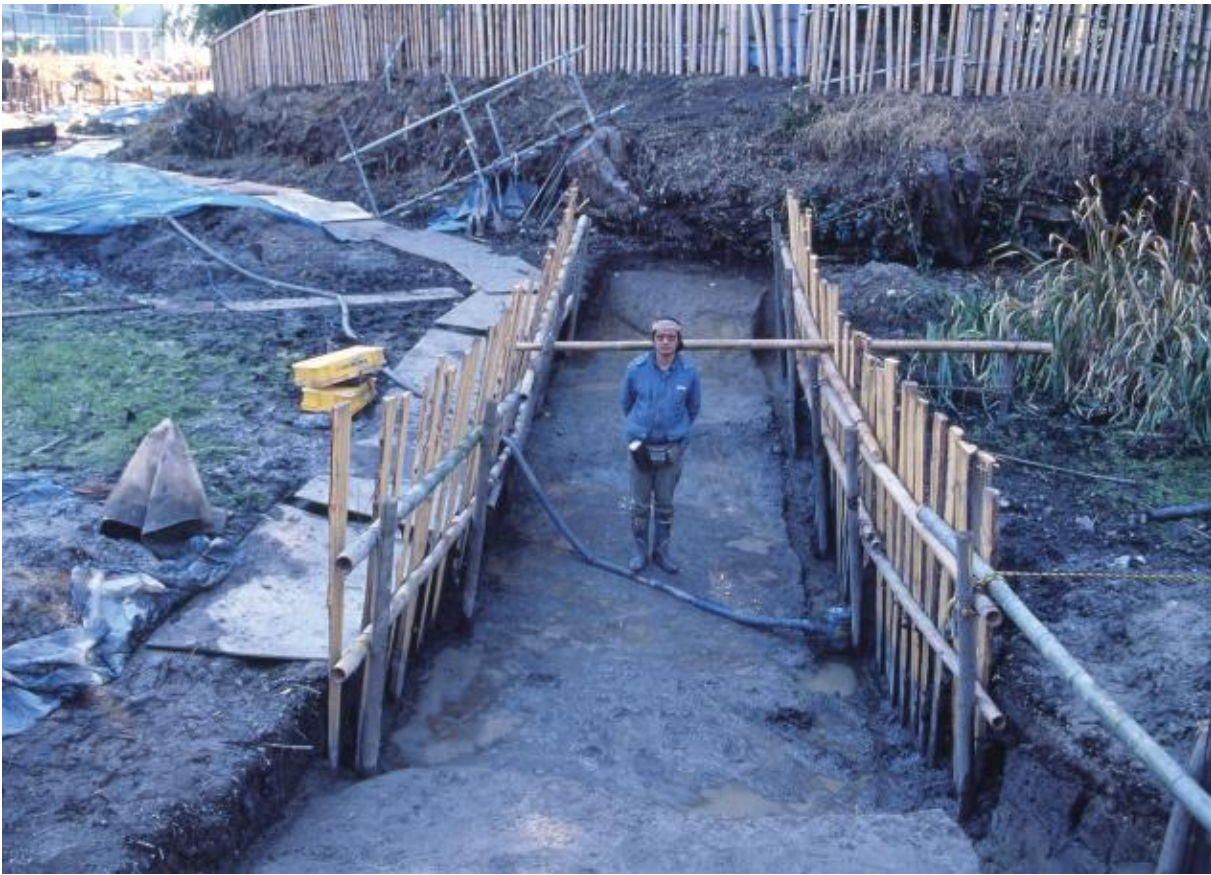
(1) 第2次調査 東堀北東部2-1トレンチ (北から)