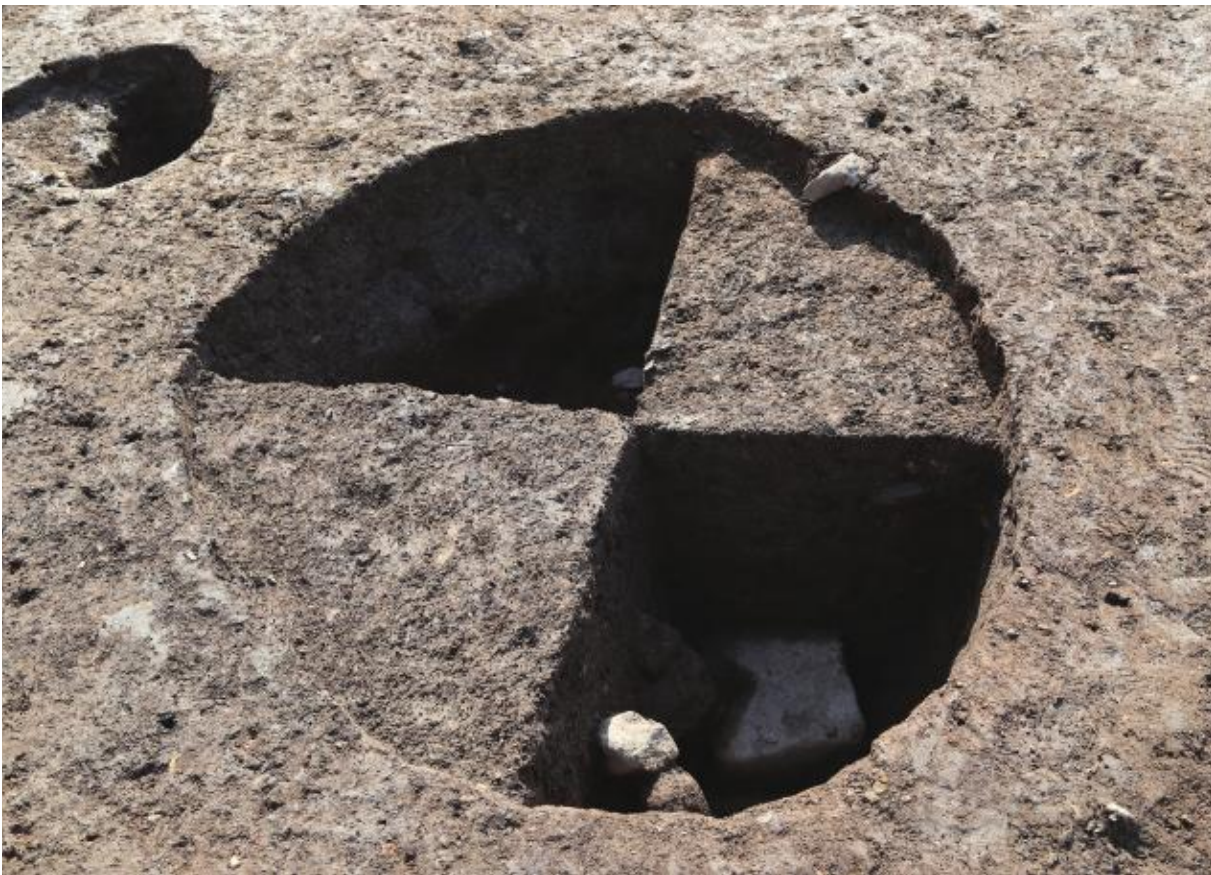
(2) 第10次調査 土坑S K 1001 (西から)