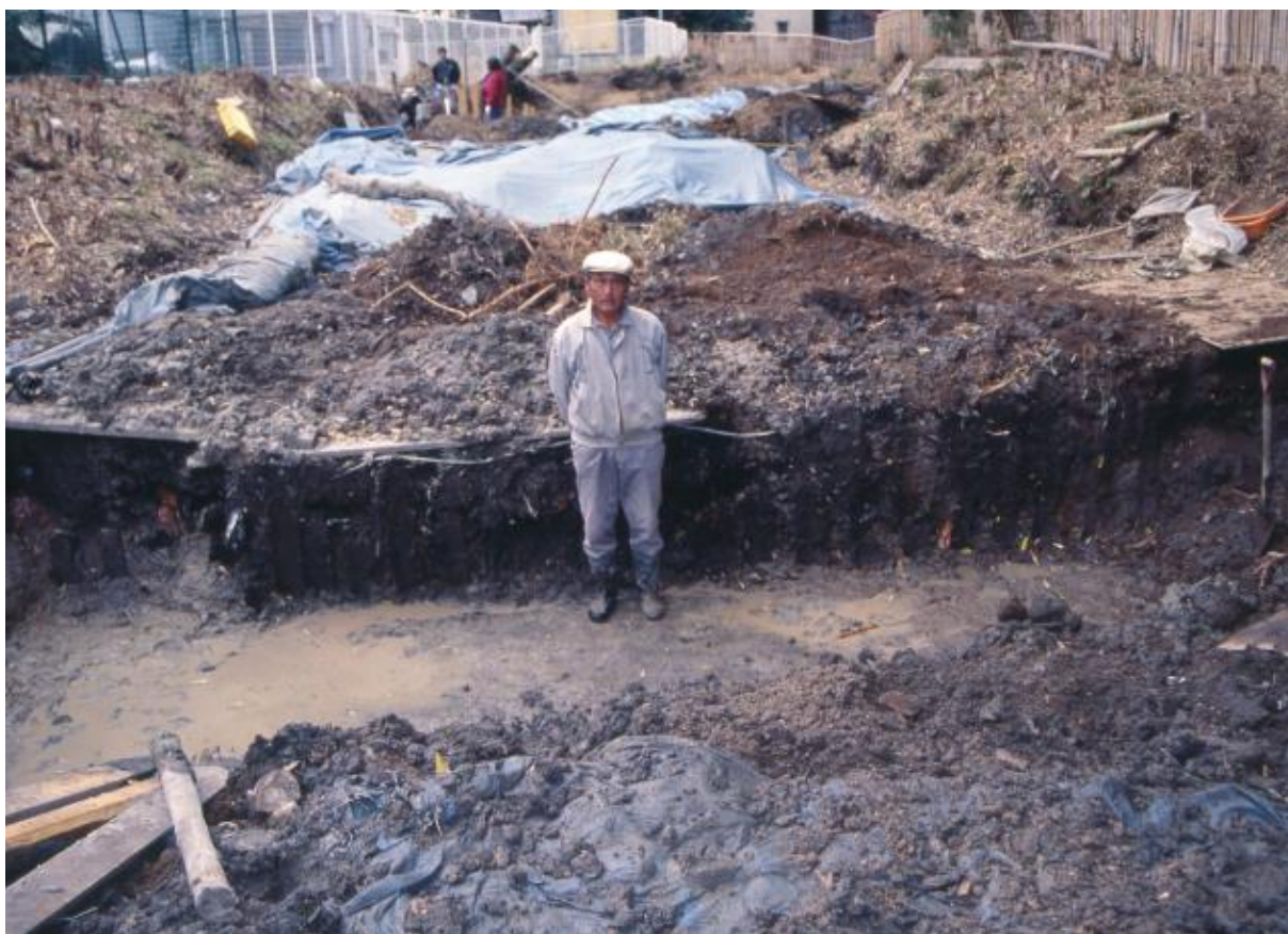
(2) 第2次調査 東堀中央部2-2トレンチ (北から)