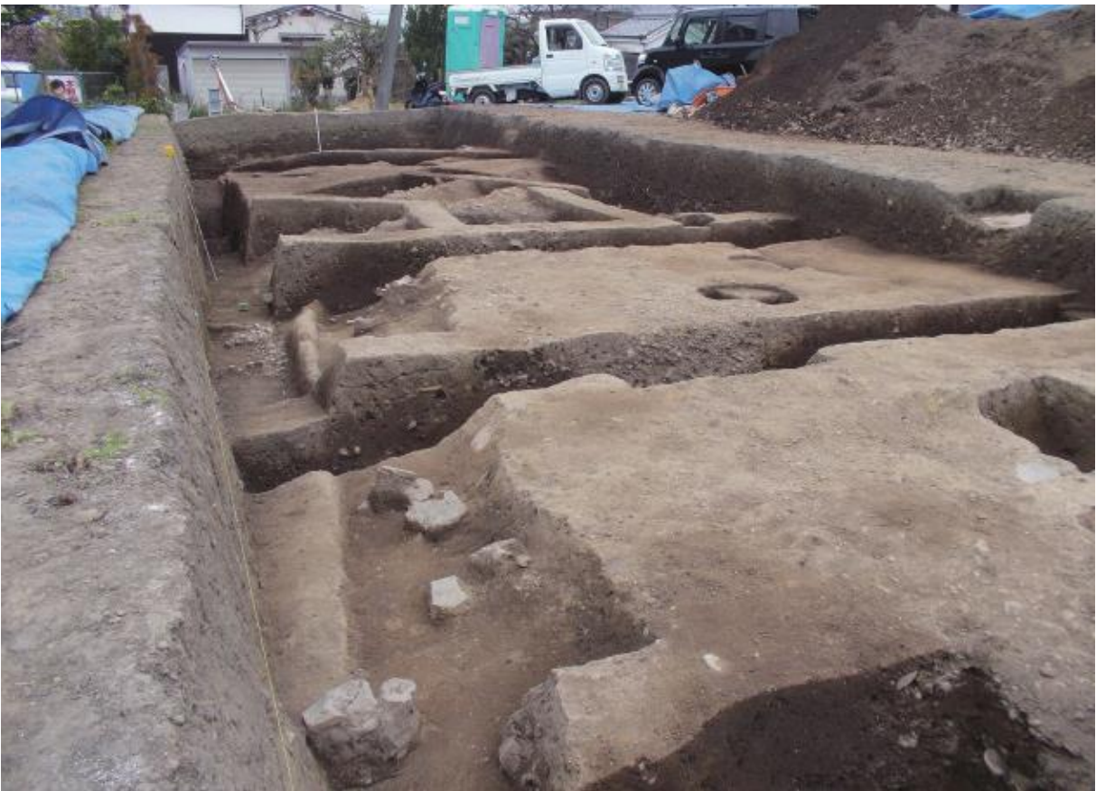
(2) 中海道遺跡第73次調査全景（南西から）