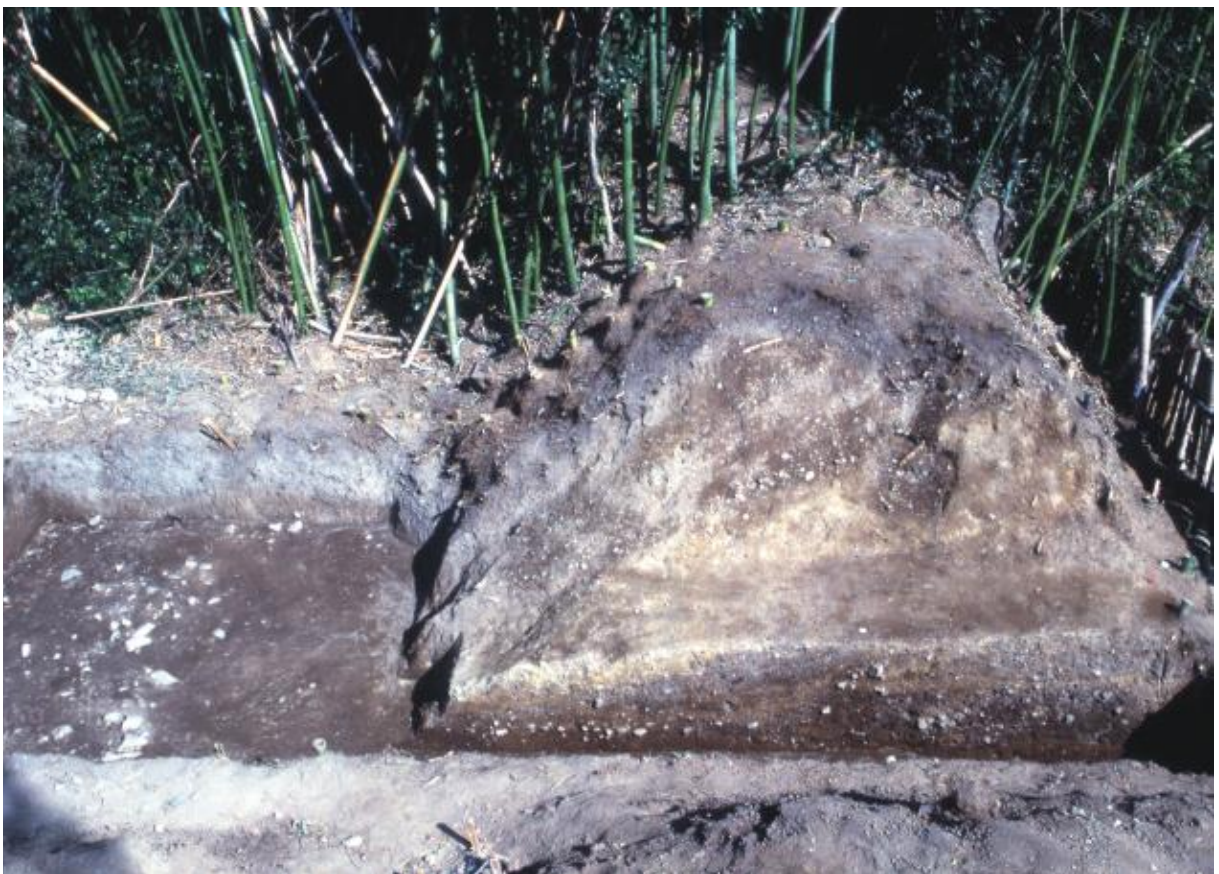
(2) 第4次調査 東土塁-2 (南から)