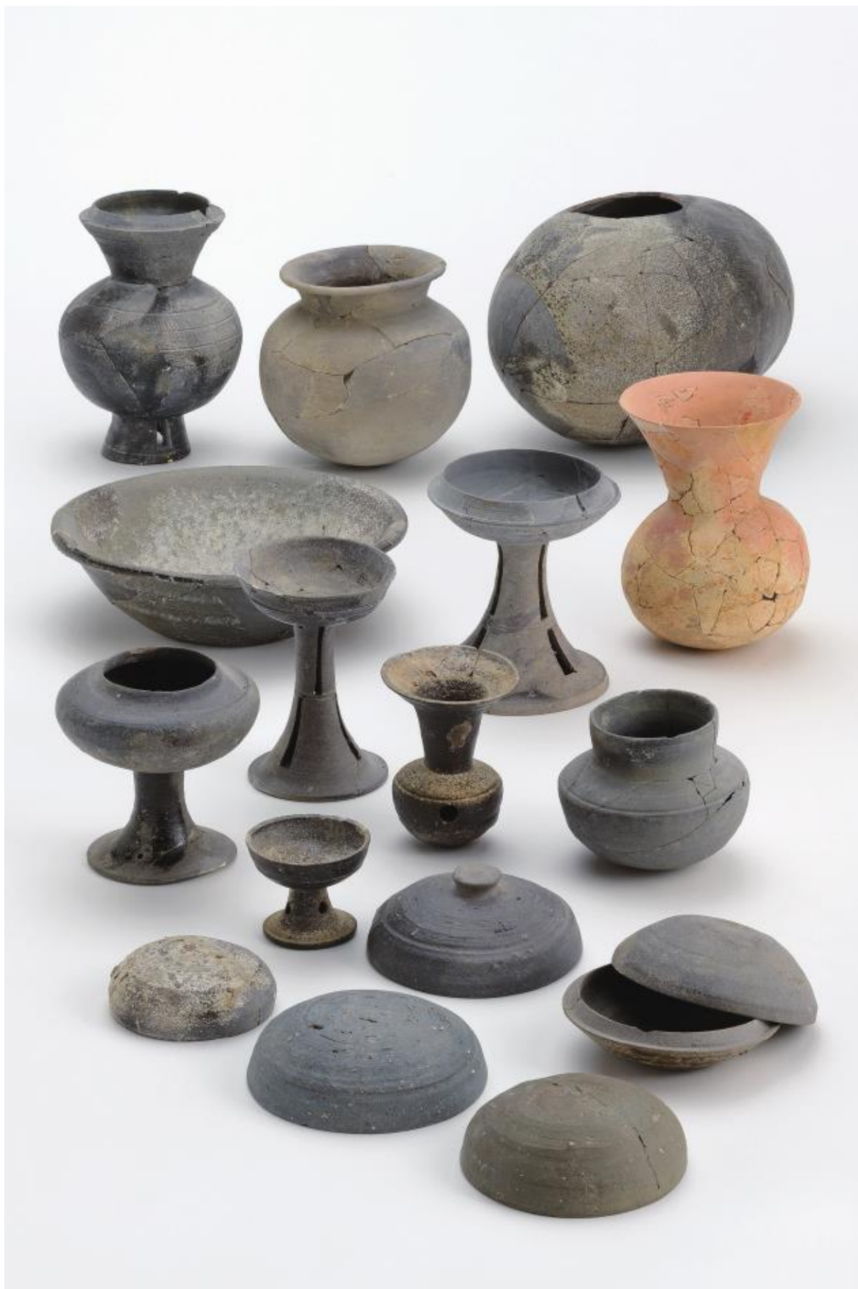
物集女城跡周辺出土遺物 - 7 (物集女車塚古墳第3次)