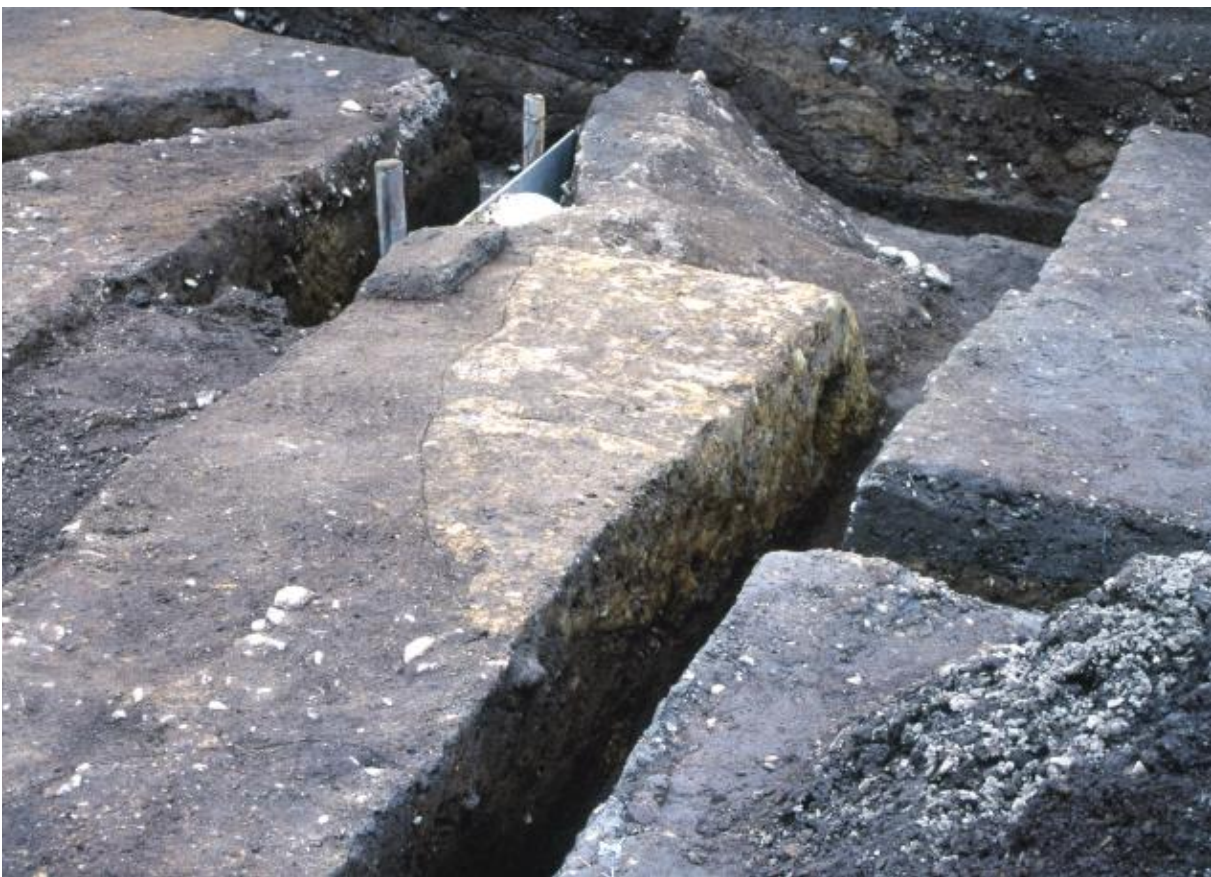
(2) 第5次調査 土塁南西隅部-3 (南東から)