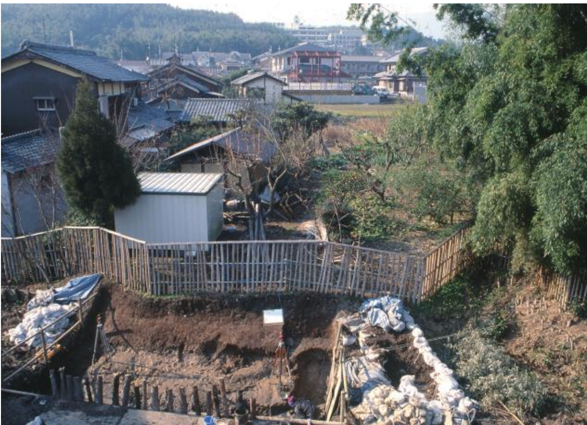
(2) 第3次調査 東堀南部3-3トレンチ (東から)