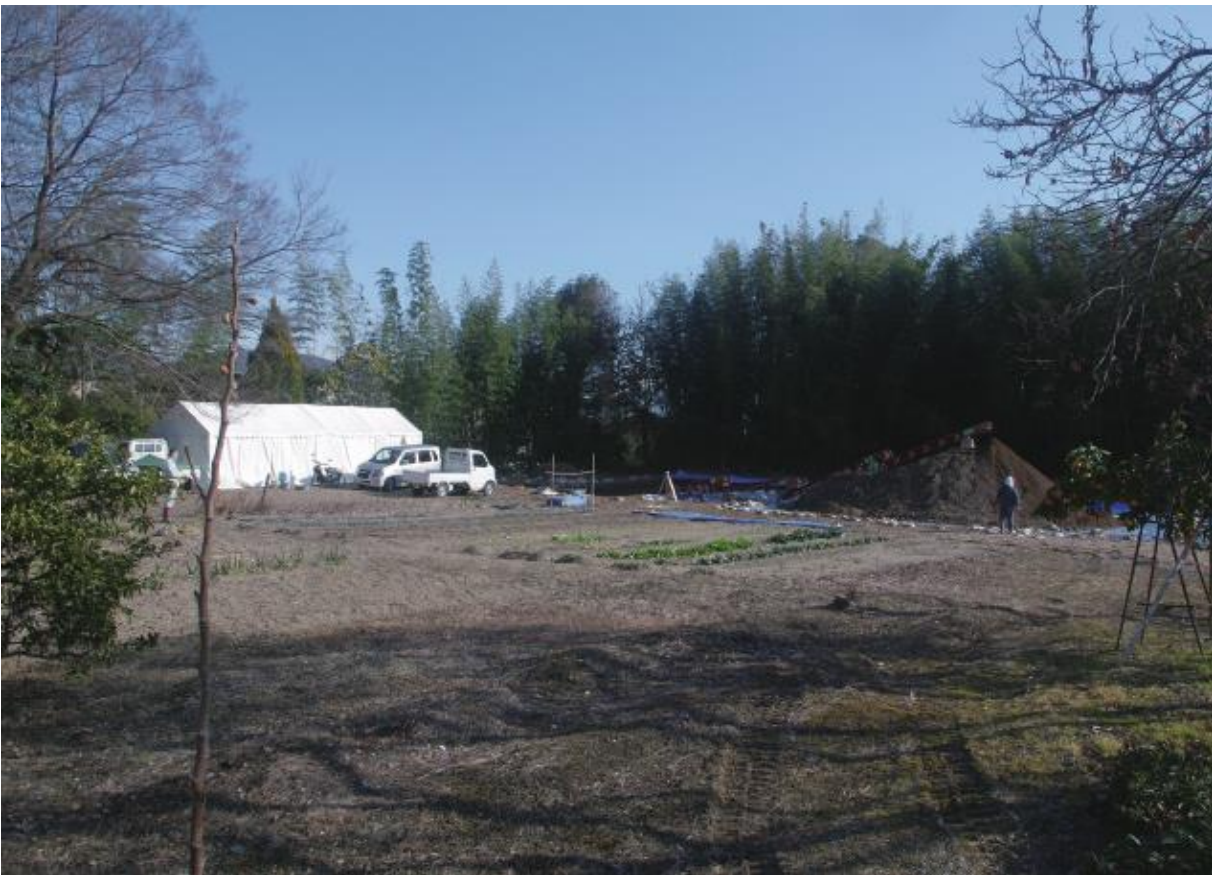
(2) 調査地遠景-2 (南西から、平成31年撮影)