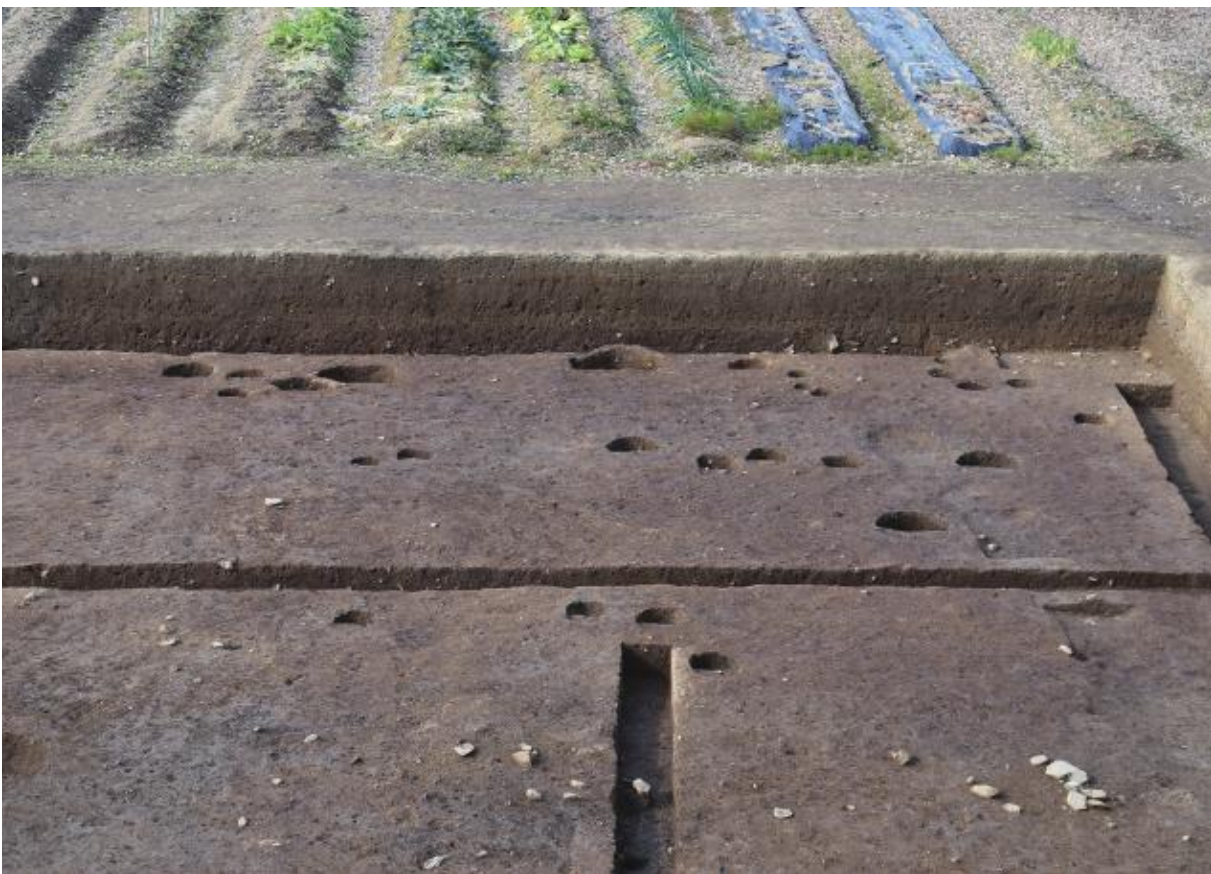
(2) 第 10 次調査北西部 (東から)