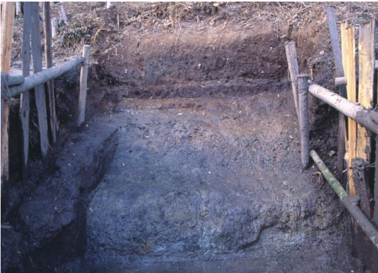
(2) 第2次調査 東堀中央部2-3トレンチ土壘下部 (東から)