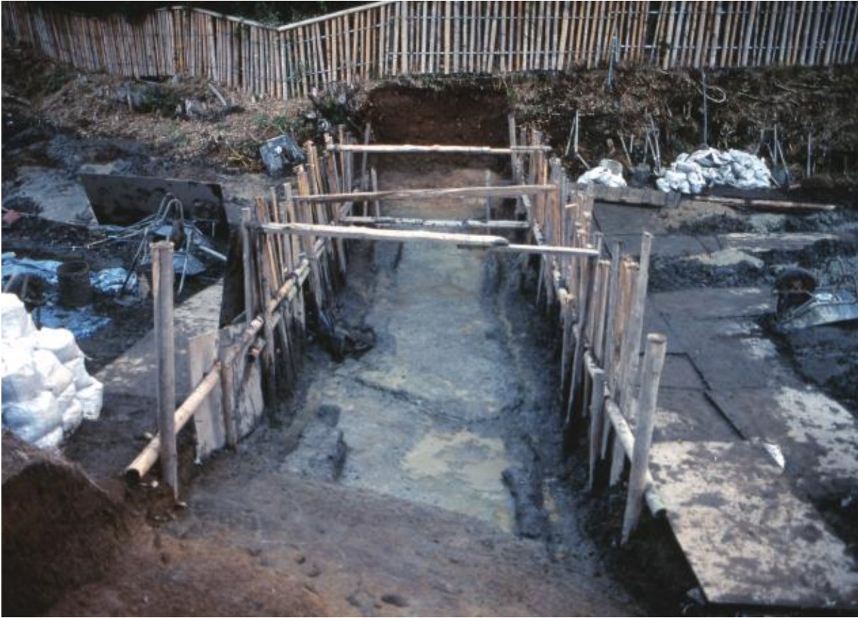
(1) 第3次調査 東堀北東部3-2トレンチ (北東から)