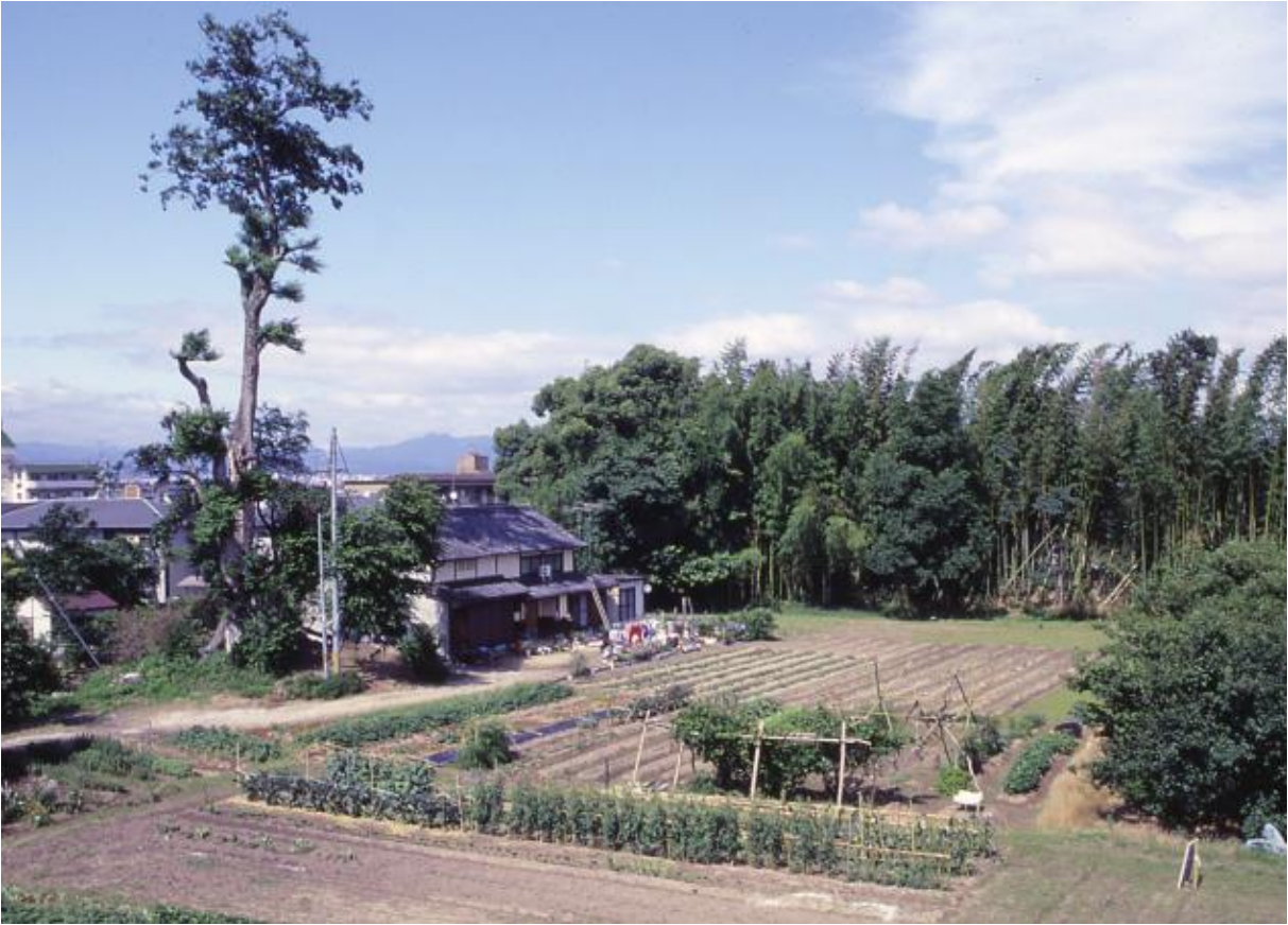
(1) 調査地遠景-1 (南西から、平成10年撮影)