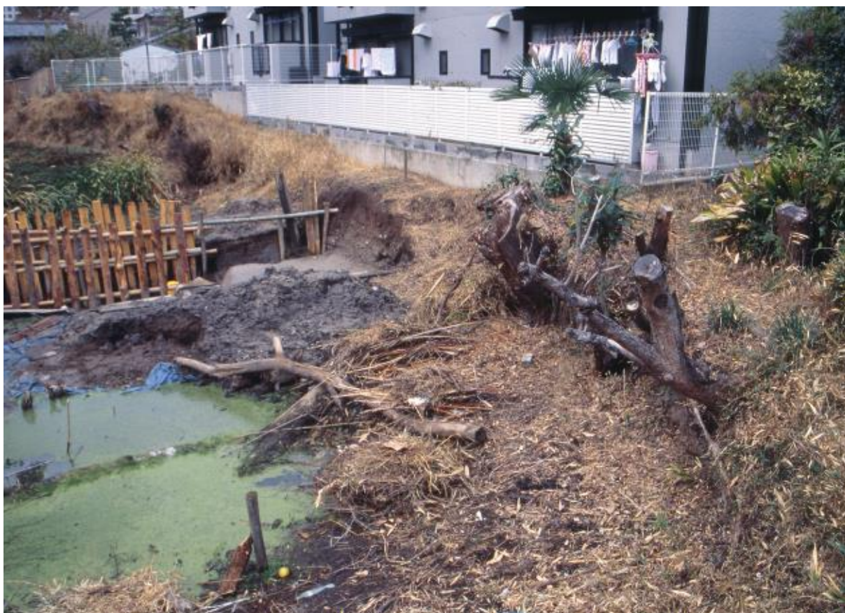
(2) 第2次調査 北堀北堤部 (東から)