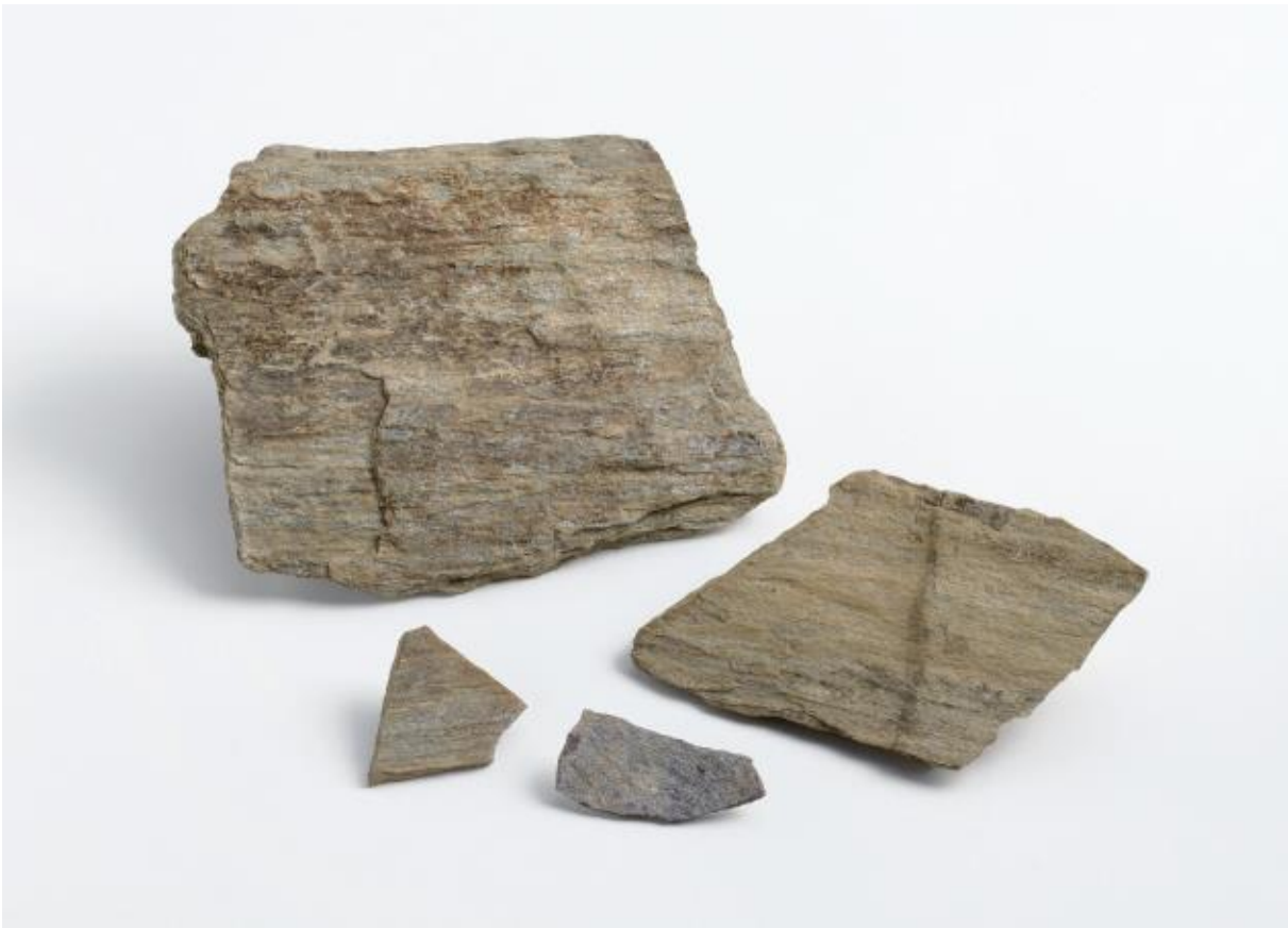
(1) 物集女城跡周辺出土遺物 - 11 (物集女車塚古墳第3次)