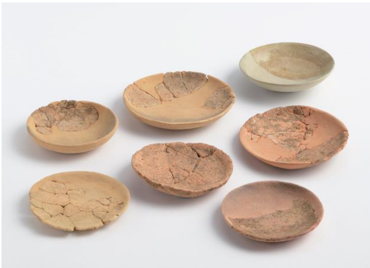
(1) 物集女城跡周辺出土遺物 - 13 (物集女車塚古墳第 2 次)