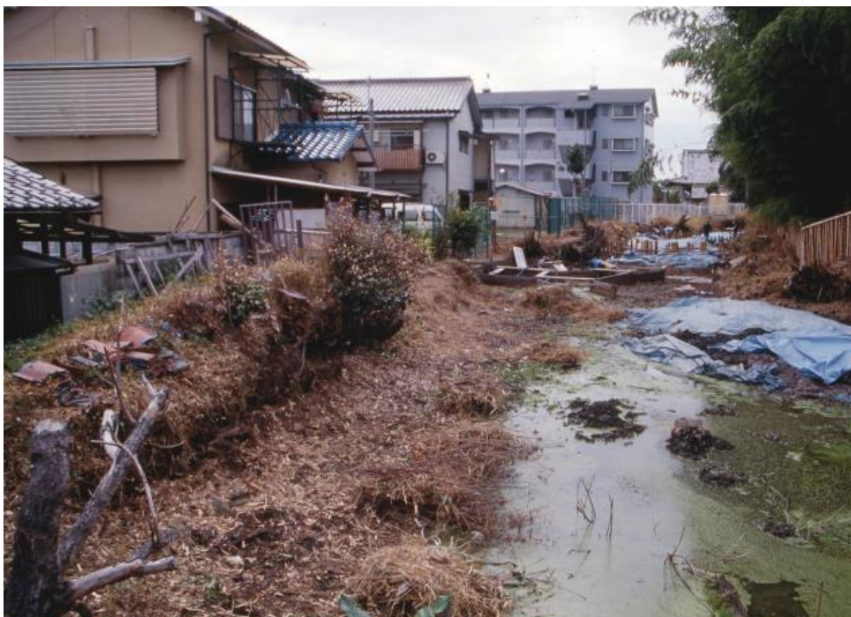
(2) 第2次調査 東堀 (北から)