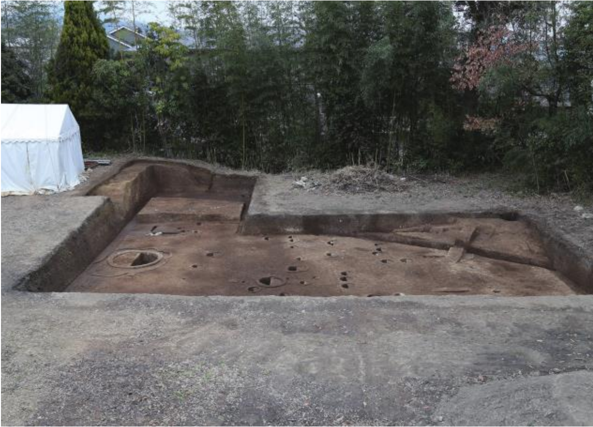
(1) 第11次調査全景（南から）