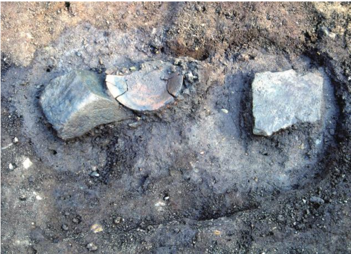
(2) 中海道遺跡38次調査 ピットP 31 (北から)