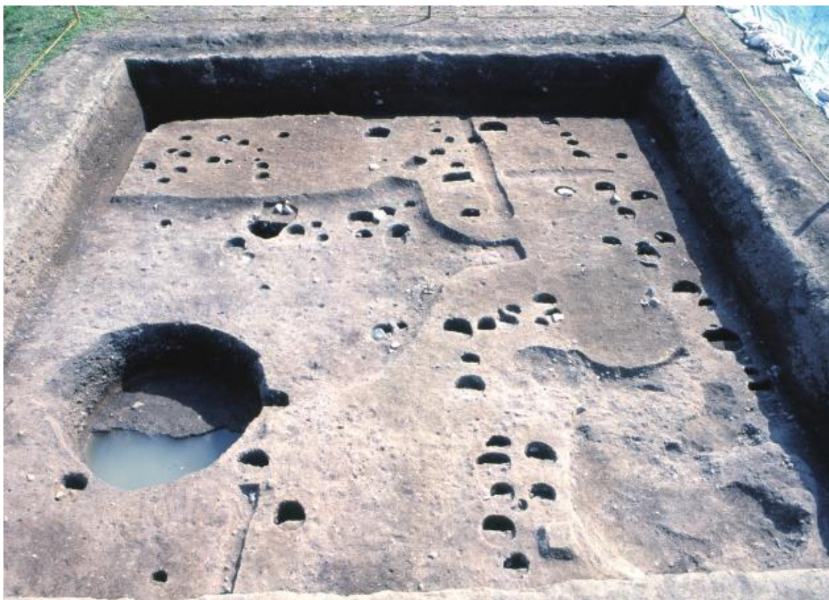
(1) 第7次調査全景 (北から)