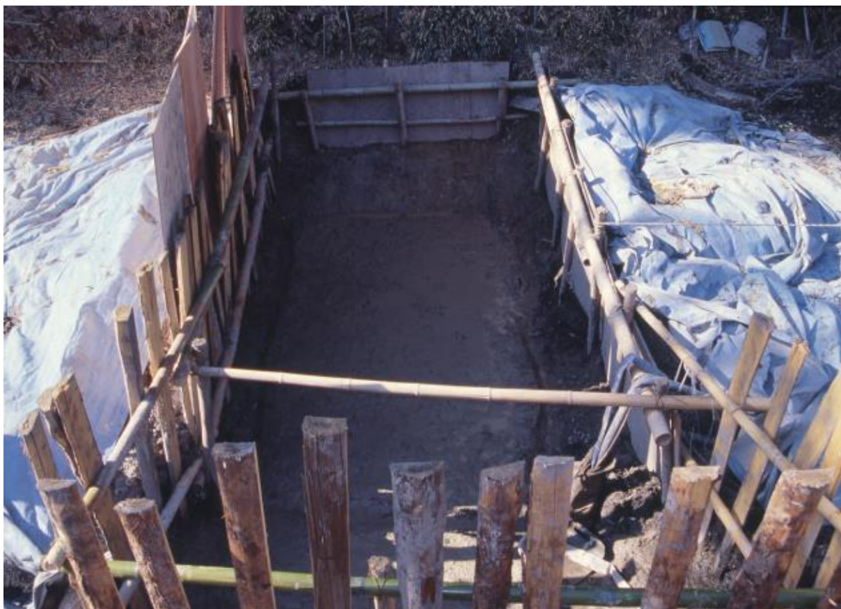
(1) 第2次調査 東堀中央部2-2トレンチ (東から)