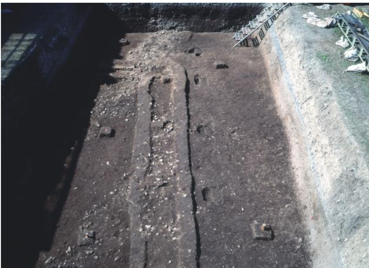
(2) 第9次調査第1トレンチ 溝S D 0901・柵S A 0907 (北東から)