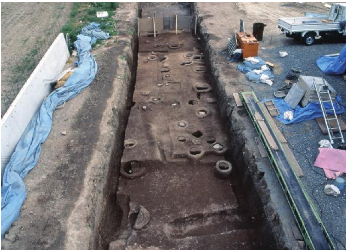
(1) 中海道遺跡第38次調査全景（北から）