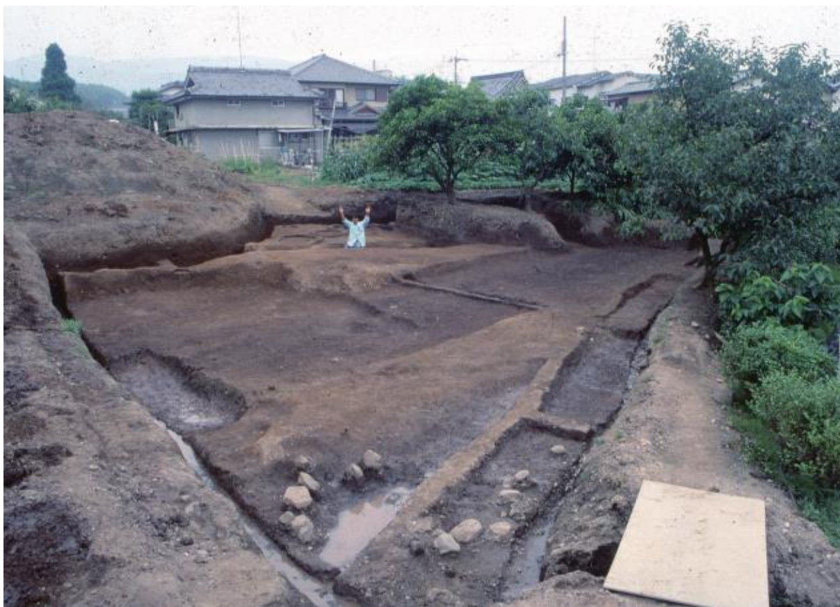
(1) 中海道遺跡第21次調査全景（南東から）