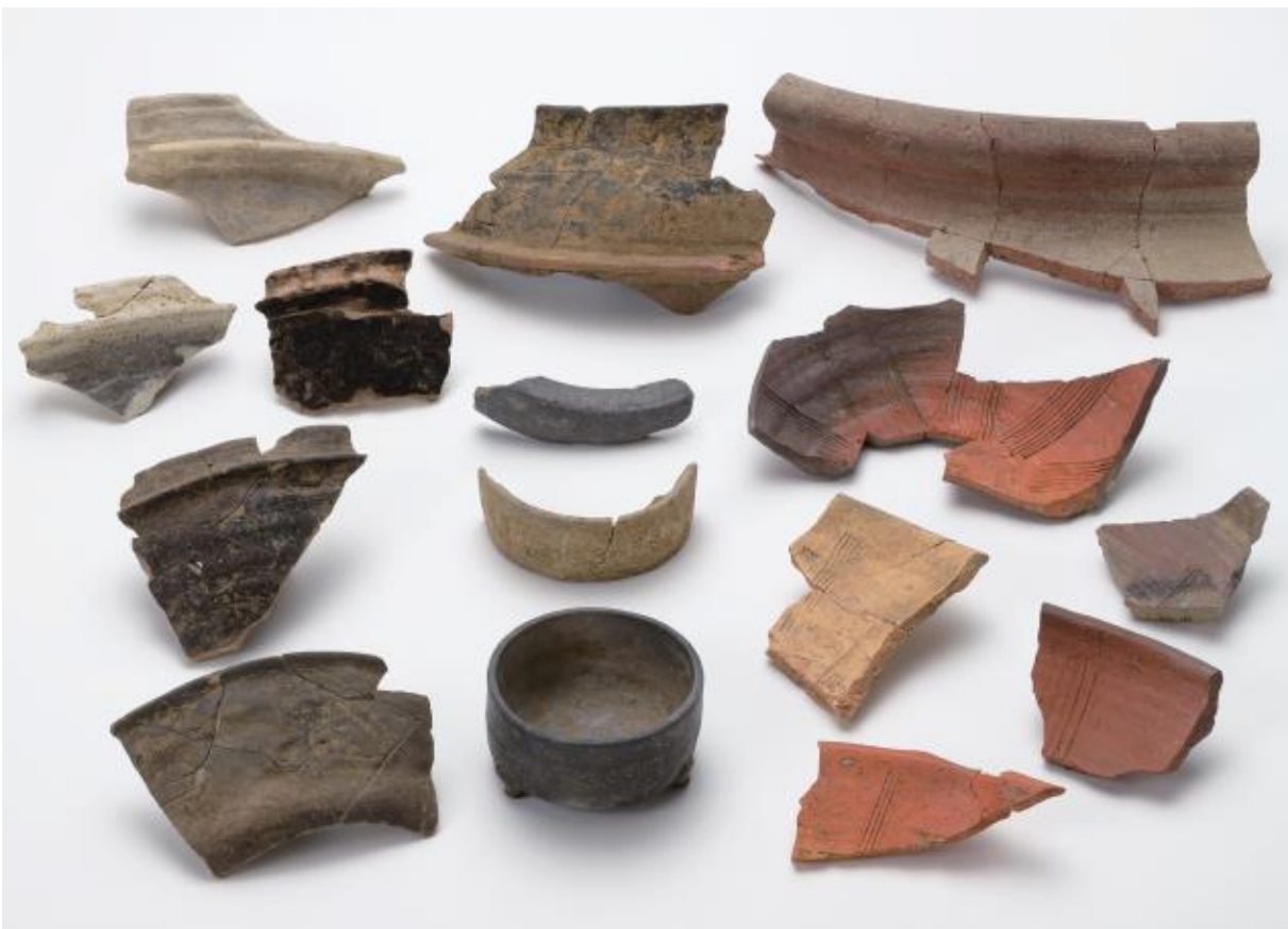
(2) 物集女城跡出土遺物 - 2