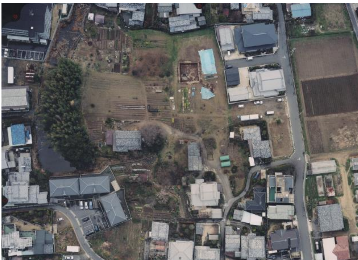
(2) 全景空撮写真-2 (南から、平成17年撮影)