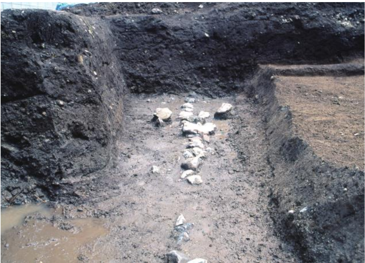
(2) 中海道遺跡第37次調査 溝S D 0704・石組S X 0721 (西から)