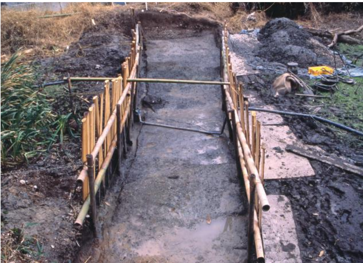
(2) 第2次調査 東堀北東部2-1トレンチ (南から)