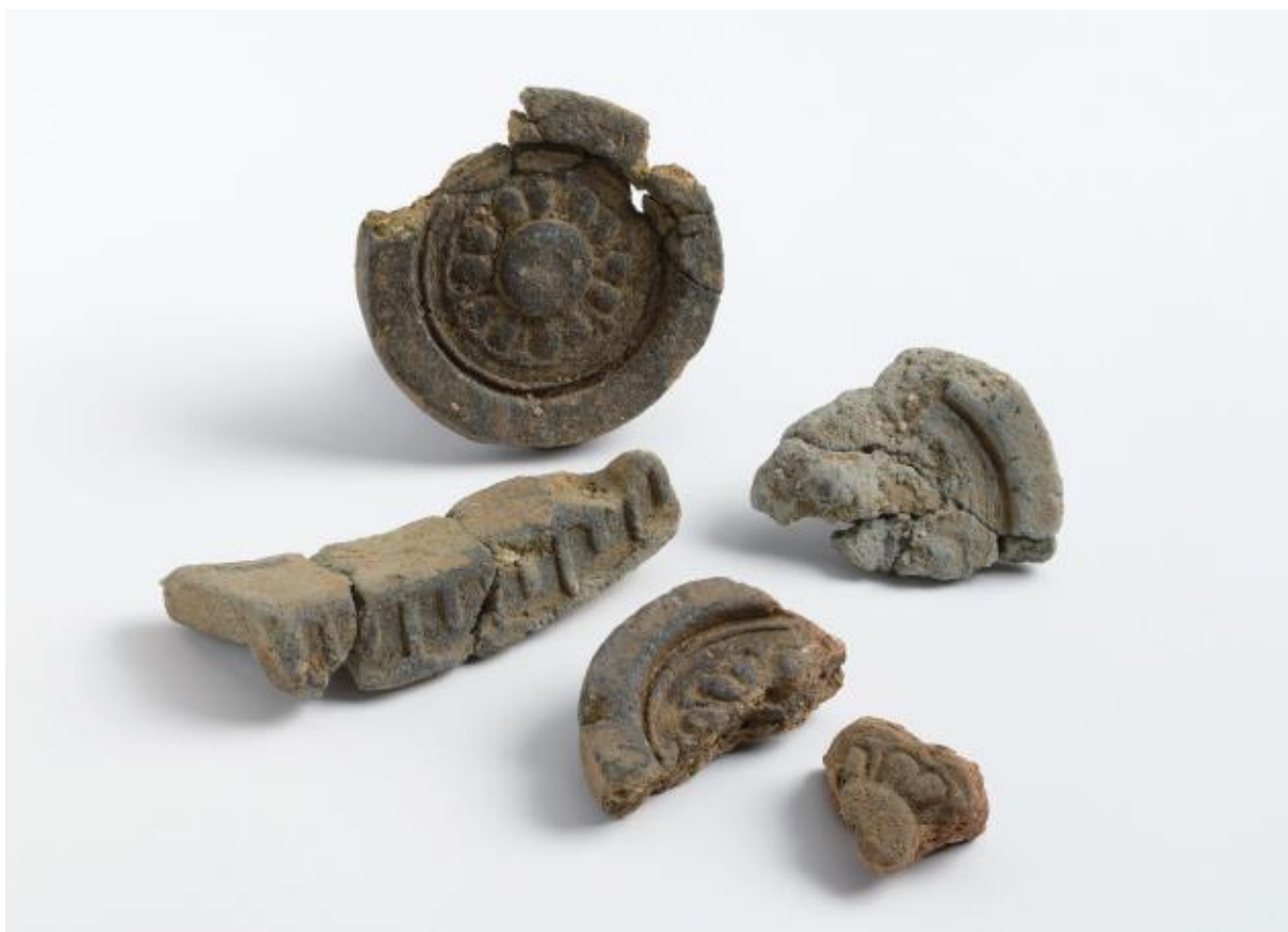
(2) 物集女城跡周辺出土遺物 - 14 (中海道遺跡第 29 次)