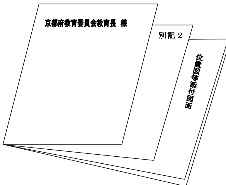
届出書・通知書の綴じ方

提出先……向日市教育委員会 文化財調査事務所 〒617-0004 向日市鶏冠井町上古 23 Tel.075-931-9901