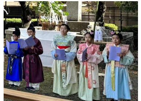
学んで語ろう！古代のみやこ・長岡京