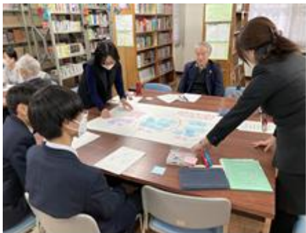
コミュニティ・スクール (学校運営協議会)