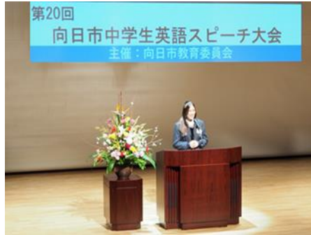
中学生英語スピーチ大会