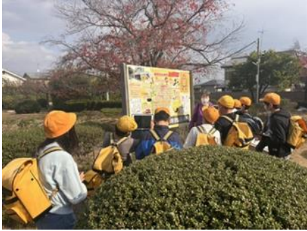
ふるさと学習(大極殿公園)