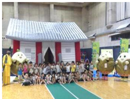
あそんで！まなぶ！『ふわふわ！朝堂 in』