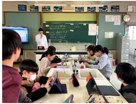
ICT を活用した授業(理科)