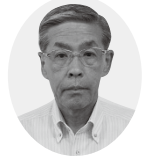
公明党議員団 福田正人議員