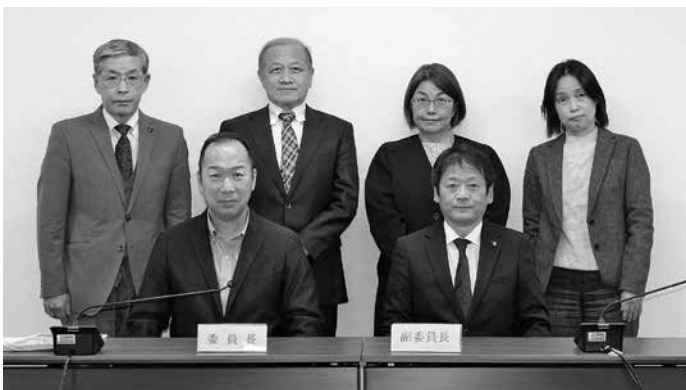
撮影時のみマスクを外しています