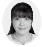
令和自民クラブ 松本美由紀議員