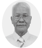
日本共産党議員団 佐藤新一議員