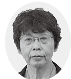
日本共産党議員団 山田千枝子議員

環境経済部長 指定ごみ袋で分別の徹底を促し、燃やすごみの中に不適正なごみや資源化可能なごみの混入を防ぐことごみの減量化、資源化を推進する必要がある。引き続き市民の皆様とともにより一層のごみ減量に取り組んでまいりたい。