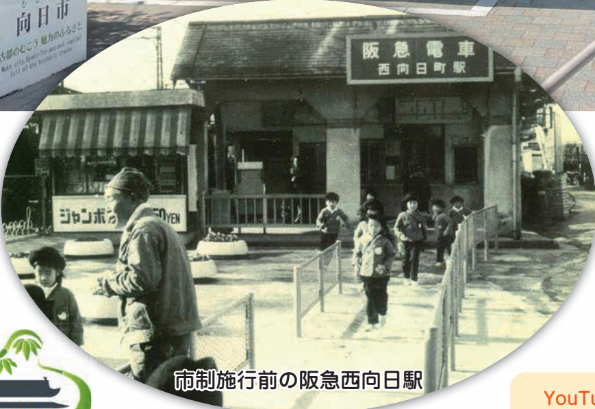
市制施行前の阪急西向日駅