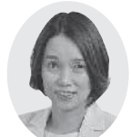
日本共産党議員団 北林智子議員