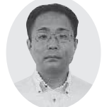
日本共産党議員団 米重健男議員