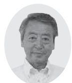
日本共産党議員団 丹野直次議員

総務部長 若手技術系職員を確保するための取り組みとして令和3年は「向日市まちづくり見学ツアー」の実施や、高校生をインターン生として迎え職場体験を実施した。今年度は技術職の採用試験の実施時期を早めるとともにリクルート活動を実施している。 ○その他の質問 電子契約書の導入について 金融教育について