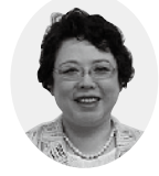
公明党議員団 長尾美矢子議員