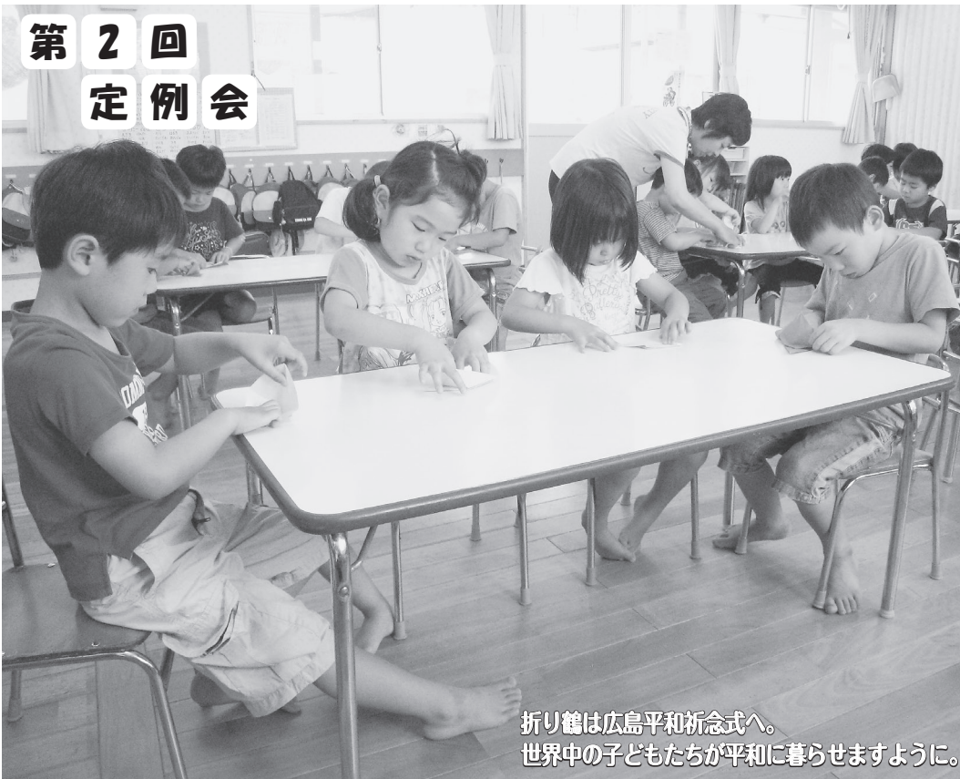
折り鶴は広島平和祈念式へ。 世界中の子どもたちが平和に暮らせますように。