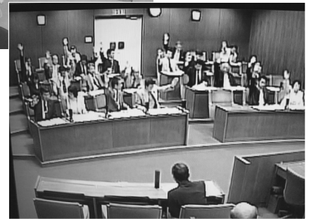
モニター映像 (イメージ)

編集後記 第2回定例会では、24人の議員中16人という多くの議員が市政の諸問題、市民要望について市長に一般質問し、議会の活性化に努めています。本会議や各常任委員会の傍聴にぜひおこし下さい。 また、会期中に全議員が出席し、第1回議員定数削減検討会が開かれました。今後の議論にご注目下さい。 議会活性化特別委員会