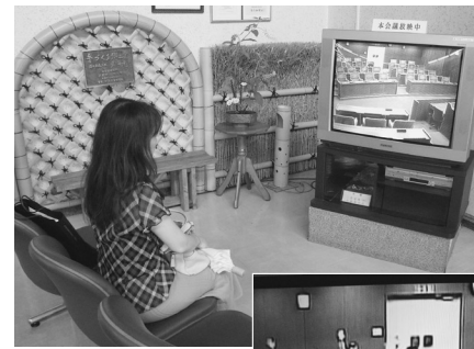
本館1階ロビー (イメージ)