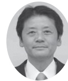
新政クラブ 上田雅議員