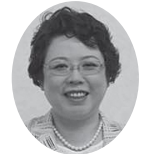
公明党議員団 長尾美矢子議員