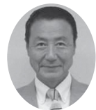
日本共産党議員団 松山幸次議員