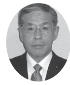
公明党議員団 福田正人議員