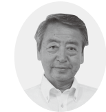
日本共産党議員団 丹野直次議員

4月から会計年度任用職員制度が施行される。会計年度任用職員の給与、諸手当などについてどのような処遇改善が図られたのか。