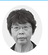
日本共産党議員団 山田千枝子議員