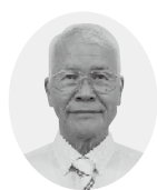
日本共産党議員団 佐藤新一議員