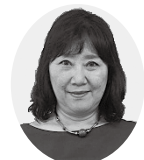
日本共産党議員団 常盤ゆかり議員