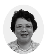
公明党議員団 長尾美矢子議員