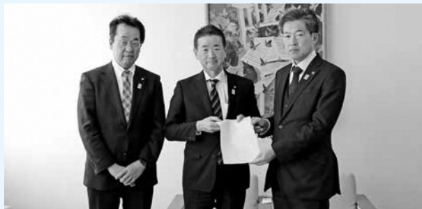
新型コロナウイルス感染症対策に関する緊急決議

令和2年第1回定例会において全会一致で可決した、新型コロナウイルス感染症対策に関する緊急決議を、令和2年3月17日に向日市長に提出しました。