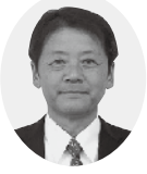
令和新政クラブ 上田雅議員