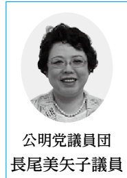
公明党議員団 長尾美矢子議員