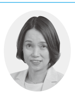
日本共産党議員団 北林智子議員