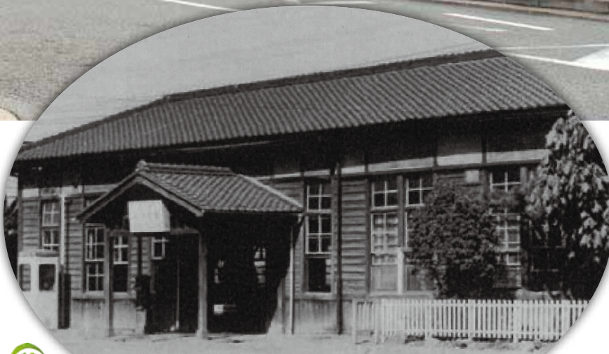
市制施行前の国鉄向日町駅