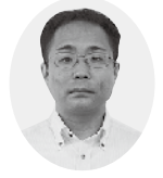
日本共産党議員団 米重健男議員