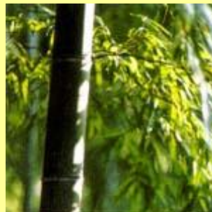
モウソウチク (孟宗竹)