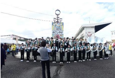
マーチングバンド

…主に市内で活動する団体等がダンスや演奏を披露。長岡京時代の衣裳を披露する「大極殿衣裳行列」、戦国時代に乙訓地域を治めていたリーダーの武士たち「西岡衆」を再現した「西岡衆武者行列」、向日香夜衆による「向日かぐや太鼓」、子どもたちに大人気のキャラクターショーなども登場。