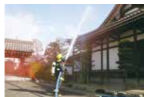
▲昨年の南真経寺での文化財防火訓練