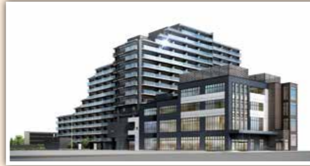
▲外観イメージ(南西方向から) 東向日別館は右手前の3階・4階の事務所スペース部分

市民の皆さまにとってより気軽で、身近な市役所になるよう、さらなる市民サービスの向上を図ります。