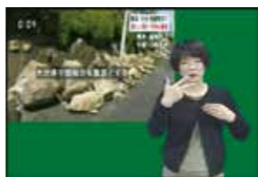
災害発生時の受信イメージです

災害発生時に、手話と字幕による災害情報が流れます。市民体育館の他に新たに保健センターにも設置しました。