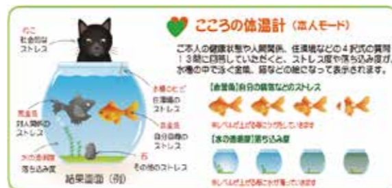
「このころの体温計」のイメージ図

パソコン( https://fishbowline.jp/mukon )やスマートフォン、携帯電話から、ストレスの状態を手軽にチェックできるシステムです。ぜひご利用ください。市ホームページからも検索できます。