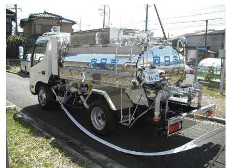
きゆうすいしゃ 給水車