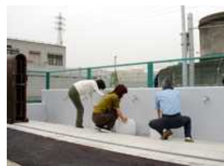
おうきゆうきゆうすいせん 応急給水栓 (上植野浄水場)

地震などの災害時における飲料水確保のため、第1配水池と上植野浄水場に水道水を供給することができる応急給水栓や給水車を配備しています。