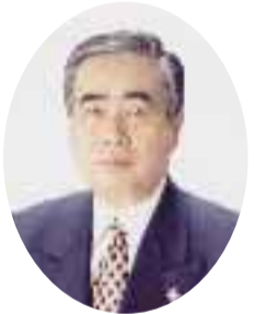
向日市長 田崎誠之

輝かしい2001年の新春にあたり、市民の皆様にご挨拶を申し上げます。 新しいまちづくりの指針となる「第4次向日市総合計画」に基づき、市民の幸せを最優先にした健康都市づくりに職員と一丸となって取り組んでまいりたい決意でありますので、市民の皆様のお一層のご支援とご協力を賜りますようお願い申し上げます。 平成十二年元旦