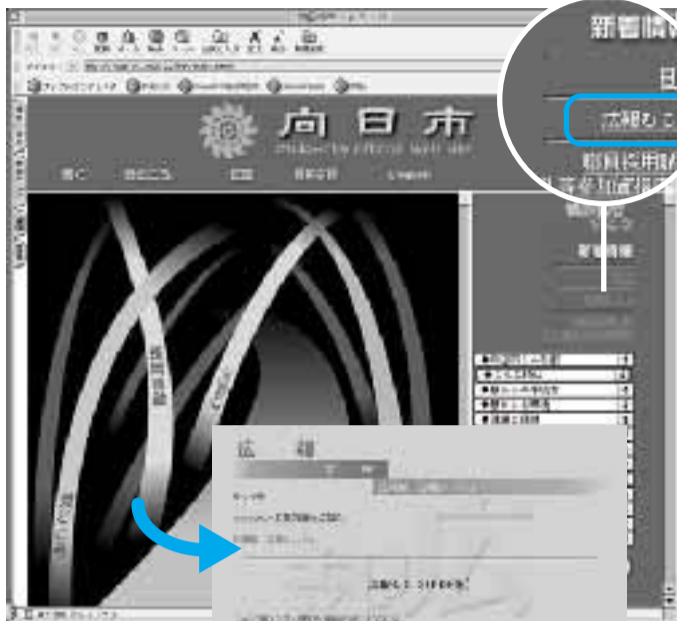
画面が「広報むこう」に切り替わります。