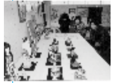
▲寺戸コミセン合同学習発表会(平成12年10月26日)

コミセンでは、自主事業として、作品展、発表会やさまざまな講座、教室などを実施し、地域住民の交流を図っています。催しの案内は、事前に「広報むこう」でお知らせします。ぜひご参加ください。