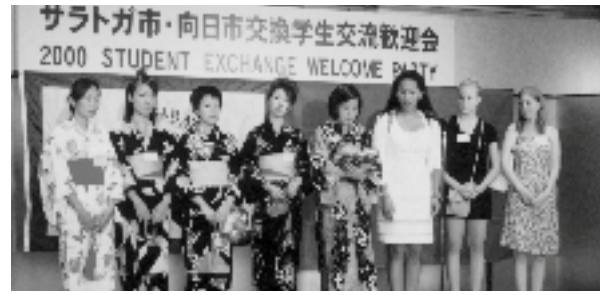
▲昨年の交換学生交流歓迎会のような