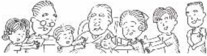
平成13年度介護保険料額一覧表(普通徴収)