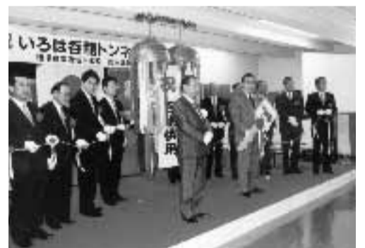
▲いろは呑龍トンネルの完成を祝う関係者

大雨が降ったとき、周辺の川が溢れ出す前にその水を取り込み、川の水位が下がった時点で、ポンプで溜めた水を川に排出します。