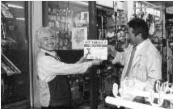
認定看板を受取る「環境にやさしい店」の店主(左)

市では、ごみ減量やリサイクルの推進に取り組む商店をこのほど「ごみ減量推進協力店」として認定し、認定看板を交付しました。認定店では、包装紙や紙袋の簡素化、再生品を使用したエコマーク商品の販売など、環境に配慮した取り組みが行われます。