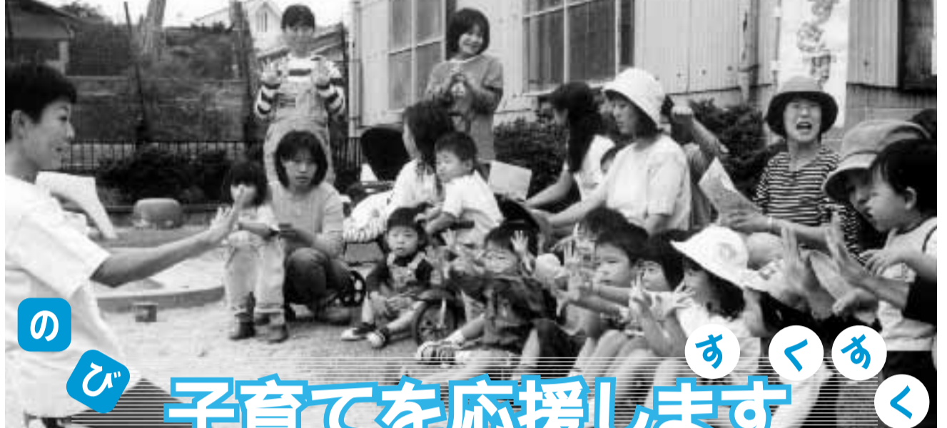
子育て支援センター秋桜の出張保育「ひだまり」