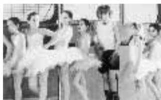
リトル・ダンサー