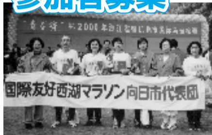
昨年の国際友好西湖マラソン向日市代表団