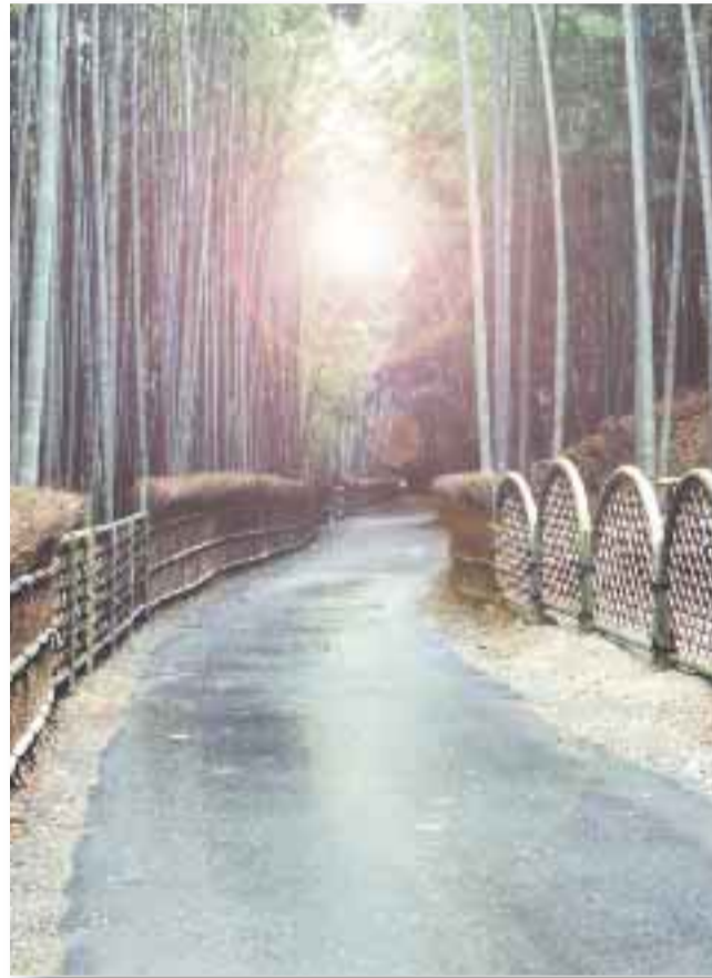
平成13年度手づくり郷土賞(国土交通省)に認定された「竹の径」