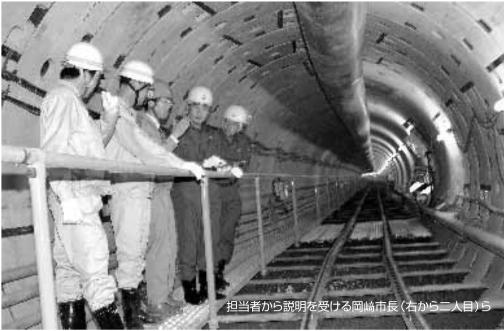
担当者から説明を受ける岡崎市長(右から二人目)ら