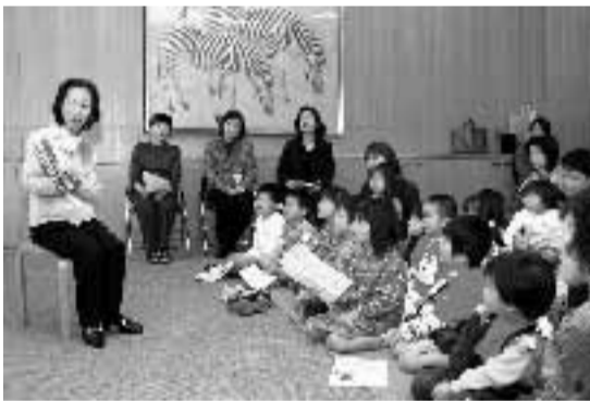
▲市民ボランティアによる「おはなし広場」。子どもたちは読み聞かせを通じて読書の楽しさを知る。