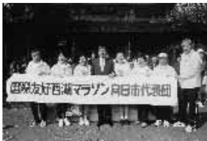
昨年の国際友好西湖マラソン向日市代表团

向日市の友好交流都市、杭州市の西湖畔を走る、「2002国際友好西湖マラソン大会」の参加者を募集しています。