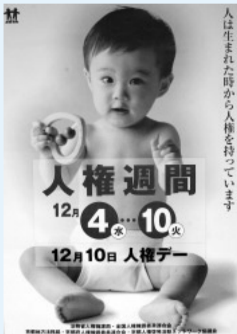
法務省の啓発ポスター