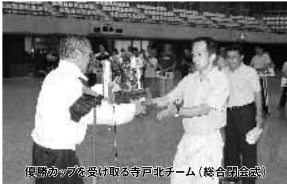
優勝カップを受け取る寺戸北チーム(総合閉会式)