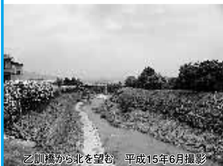
乙訓橋から北を望む 平成15年6月撮影

流れの転換点に架かる一文橋は、小畑川の橋としてはもっとも有名で、その名の通り、通行する人から1文をとった日本最初の有料橋、という言い伝えで知られています。東寺から摂津西宮に至る西国街道が、小畑川を渡る地点の橋であり、昔から往来がはげしく、橋の管理にも多額の経費を必要としました。言い伝えのように日本最初とはいきませんが、江戸時代後期の天保2年(1831)に「橋銭」を徴収していた記録が、最近になって乙訓の古文書を研究するグループによって発見され、名前の由来が証明されています。