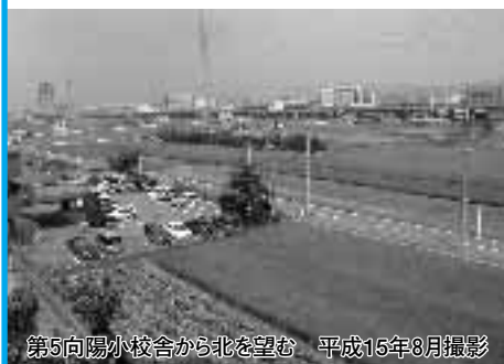
第5向陽小学校舎から北を望む 平成15年8月撮影

向日市域に残る条里の地割と地名は、1000年以上にわたって受け継がれてきました。現代のわたしたちの暮らしのなかに、今も生き続けているのは驚きでもあります。