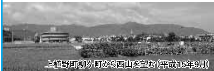
上植野町柳分町から西山を望む(平成15年9月)

西山にはまた、大原野神社や金蔵寺・三鈷寺・善峰寺など、平安京の天皇や貴族にゆかりの深い社寺が数多くあります。大正時代後期から昭和の初めにかけて訪れた観光ブームのなかでは、東海道線向日町駅が参詣の玄関口となりました。昭和3年(1928)には新京阪線(現在の阪急京都線)ができて、駅前からは西山の社寺へ向かう乗合馬車やバスが出るようになります。現代では、社寺参詣に加えてハイキングに出かける人々も多い西山ですが、やはり向日市内の駅は、その玄関口として利用され続けています。