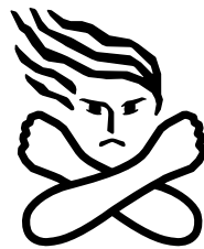
▲女性に対する暴力根絶のためのシンボルマーク

夫・パートナーからの暴力、性犯罪、売買春、セクシャル・ハラスメント、ストーカー行為など女性に対する暴力は、女性の人権を著しく侵害するものであり、決して許されないものです。