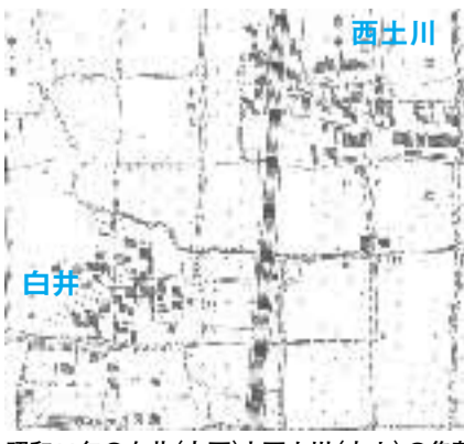
昭和11年の白井(左下)と西土川(右上)の集落

森本区の誕生130周年を記念する式典が、この11月23日に執り行われます。他の地区や、最近になってから森本町内にお住まいの方のなかには、何のことかと思われる方もあるかもしれません。