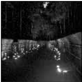
▲「かぐやのタベ〜その式〜」を開催。「竹の径」を水ろうそくで幻想的にライトアップ(10月25日)

2003年も間もなく終わろうとしています。向日市では久嶋務市長を迎えた新しい体制で、市民の皆様と「コラボレーション(協働)」によるまちづくりをスタートさせました。この一年は市民の皆様のご協力とご支援のおかげで、どんな一年だったでしょうか。2003年、向日市での出来事を写真とともに振り返ります。