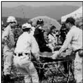
▲キンピール京都工場跡地で大地震を想定した京都府総合防災訓練を実施(9月6日)