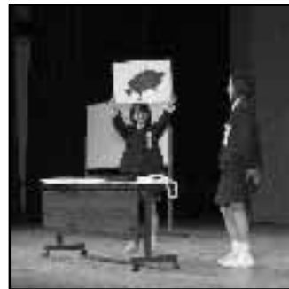
▲中学生が日ごろの学習で身に付けた英語力を披露した「英語スピーチ・暗唱大会」(10月26日)