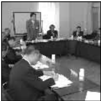
▲市長がまちに出向き、市民の皆様の生の声を聞く「タウンミーティング」が始まる(6月25日)