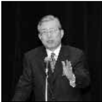
▲永守重信氏(日本電産代表取締役社長)を迎えて新春経済講演会を開催(1月17日)