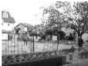
稲荷公園 平成15年12月撮影

エリアとする地域新聞)や、『乙訓郡誌』(昭和15年(1940)刊行)には、御田植祭のことが紹介されています。それらによれば、二枚田が神饌田となったのは昭和5年(1930)