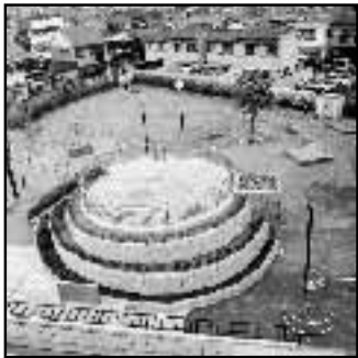
▲市民の意見を盛り込んだ深田川橋公園と、石田川1号幹線雨水トンネルが完成(4月)