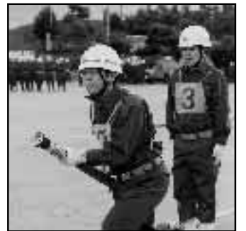
▲「消防団訓練錬成会」で消防団がポンプ車操作の技を披露。第6分団が最優秀賞(11月9日)