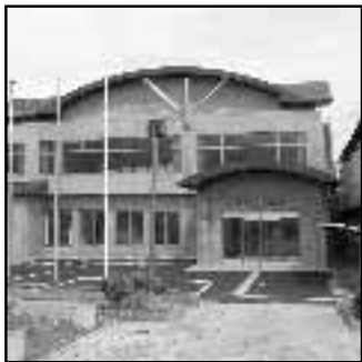
▲健康増進センター「ゆめパレアむこう」がオープン(5月9日)