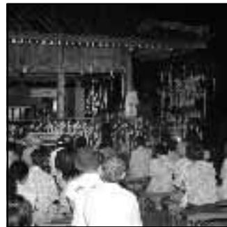
▲市民手づくりの催し「7.67星空コンサート」が盛大に開催(7月5日)