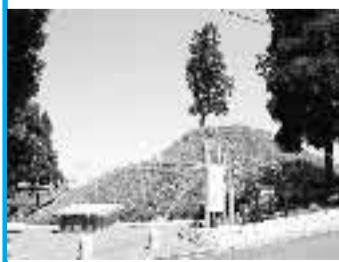
物集女車塚古墳と後円部の一本杉 平成16年4月撮影

物集女車塚は、市内物集女地区の南東隅、寺戸地区と境を接するところに位置します。向日丘陵から平地に下る尾根の先端を利用して、古墳時代後期の6世紀中頃に築かれた前方後円墳です。全長約45メートルという大きさは、丘陵上にある寺戸大塚などの前期古墳に比べると半分以下ですが、墳丘は高いところで約9メートルもあり、前方部が発達した後期古墳の典型的な姿をしています。今から1500年近く前の乙訓で、最有力の豪族の墓と考えられています。