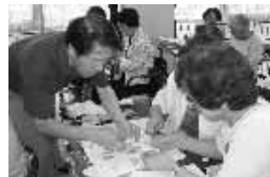
▲まなぼうやの会員がいろいろな講座を企画しています。

陶芸教室、フラワーアレンジメント教室、生け花教室、楽しい自然体験教室、編み物教室など