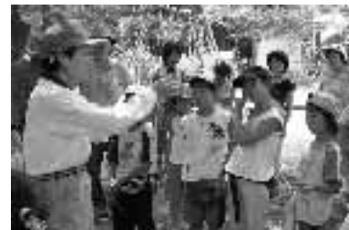
▲親子で楽しく参加できる「子どもまなぼうや講座」を開催しました。