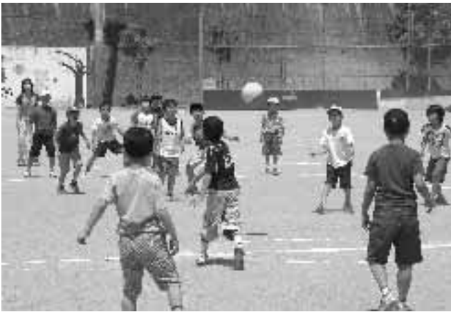
▲今年度はモデル的事業「ワイワイスポーツデー」を積極的に展開(6月5日・向陽小学校)