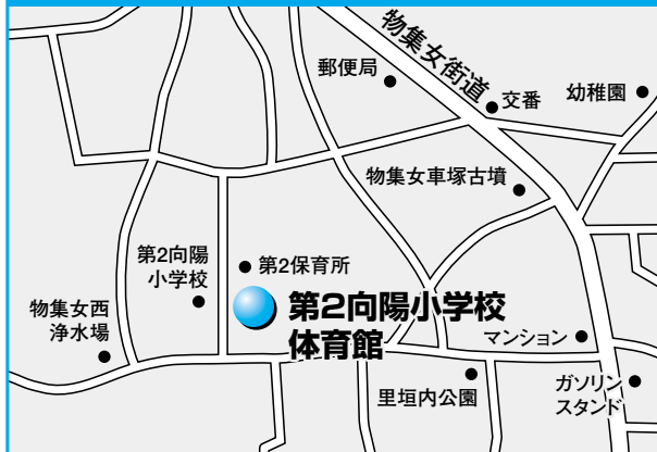
第1投票所 第2向陽小学校体育館