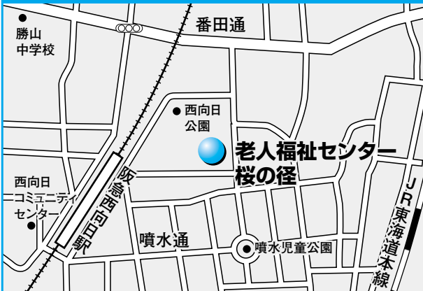
第6投票所 老人福祉センター桜の径