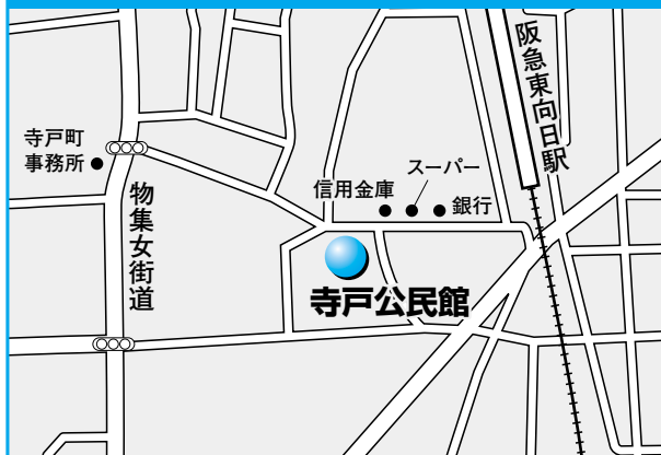
第2投票所 寺戸公民館