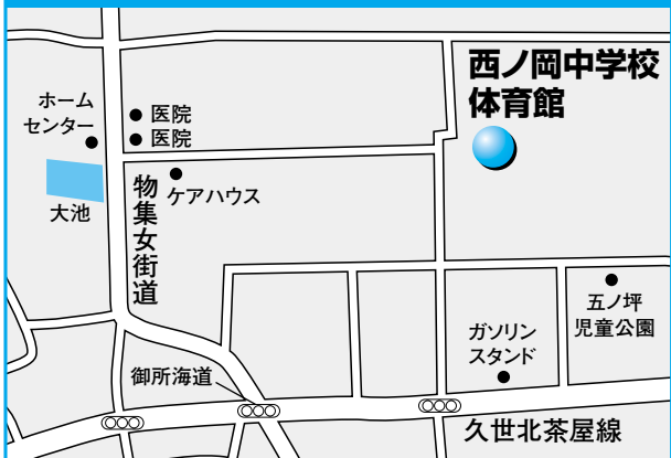
第13投票所 西ノ岡中学校体育館