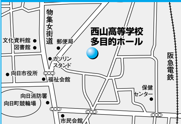
第8投票所 西山高等学校多目的ホール