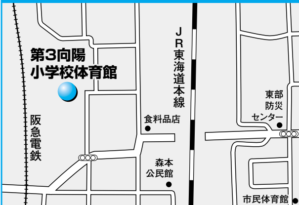
第7投票所 第3向陽小学校体育館