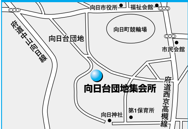
第9投票所 向日台団地集会所