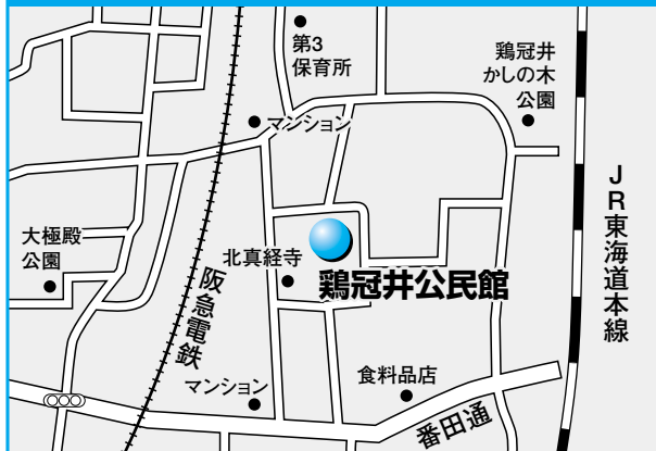
第4投票所 鶏冠井公民館