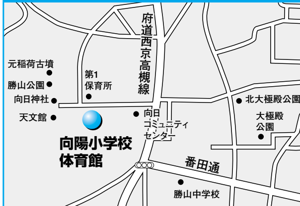
第3投票所 向陽小学校体育館