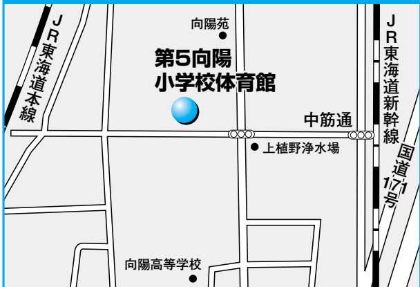
第12投票所 第5向陽小学校体育館