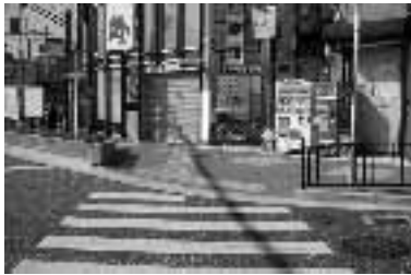
向日市道第2087号線(寺戸町初田)