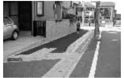
上植野幹線(上植野町九ノ坪)