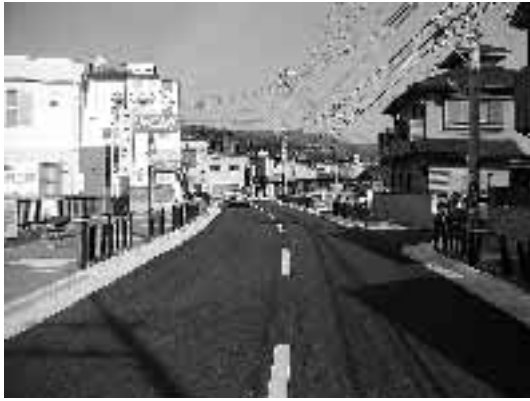
歩道と車道の拡幅改良と歩道のバリアフリー化 向日市道第2087号線(寺戸町向畑)

道路は、日常生活に最も身近な公共施設です。 8月の「道路ふれあい月間」は、道路の正しい利用と道路愛護思想の普及を図り、道路を常に広く、美しく、安全に利用する気運を高めることを目的に定められたものです。 この期間中、道路パトロールの強化や不法占用物件の撤去、道路清掃などを行います。 市では、高齢者や子どもたち、障害者など、誰もが安全で快適に利用できる、「人にやさしい道づくり」を進めています。 自転車の放置や路上駐車は、歩行者や車の通行の妨げになるのでやめましょう。また、看板や自動販売機、生け垣なども道路にはみださないよう皆様もご協力ください。