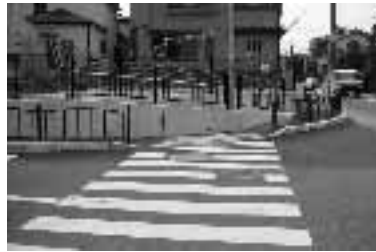
寺戸幹線6号(寺戸町古城)