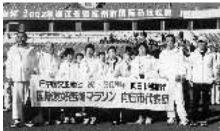
2002国際友好西湖マラソン向日市代表团

向日市の友好交流都市、杭州市の西湖畔を走る、「2004国際友好西湖マラソン大会」の参加者を募集しています。 このマラソン大会は、杭州市の友好都市、友好交流都市をはじめ世界各国からの参加者の交流を図るため開催されており、今年で17回目を迎えます。向日市も第4回大会から参加し交流を深めています。