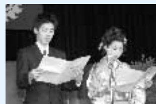
▲新成人代表による誓いの言葉

成人の日の1月10日、市民会館で成人式が行われ、新成人581人のうち、396人が出席しました。