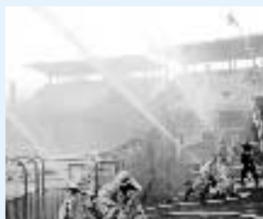
▲消防団らによる一斉放水

1月9日、新春恒例の消防出初式が消防署員、消防団員ら200人以上の参加のもと行われました。