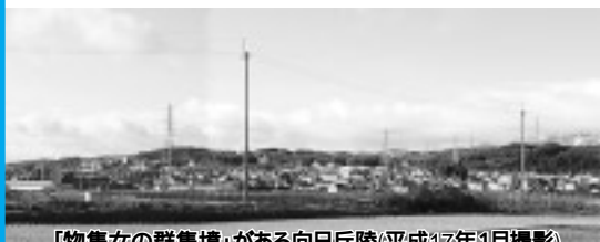
「物集女の群集墳」がある向日丘陵(平成17年1月撮影)

向日丘陵とその周辺には、今日確認されているよりはるかに多くの中小の古墳が存在し、その年代は一部は5世紀にさかのぼるものの、6世紀から7世紀初めを中心とします。これらの群集墳は、当時この地域の開発と生産を担った、数世代にわたる人々の姿を浮かび上がらせます。そしてその中から6世紀半ばには、前方後円墳という、中央政権と直接結びついた者にしか許されない特別な形をした物集女車塚に眠る有力者が登場したのでした。