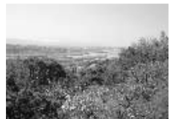
天王山・三川合流展望台(大山崎町)