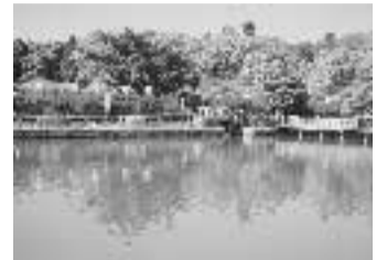
長岡天満宮(長岡京市)