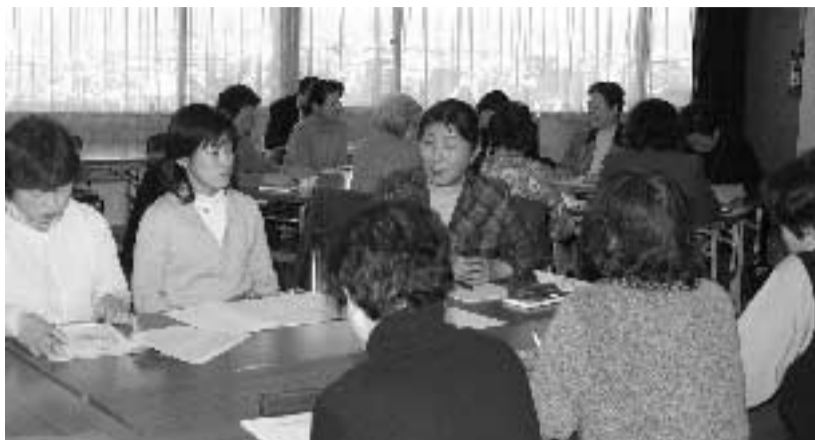
▲男女共同参画条例づくりのためのワークショップ(1月29日・市民会館)

向日市では、男女共同参画社会のまちづくりをめざし、条例制定に向けた取組を進めています。平成16年7月に「男女共同参画推進懇話会」を設置したのをはじめ、講演会、市民参加によるワークショップなどを実施しています。